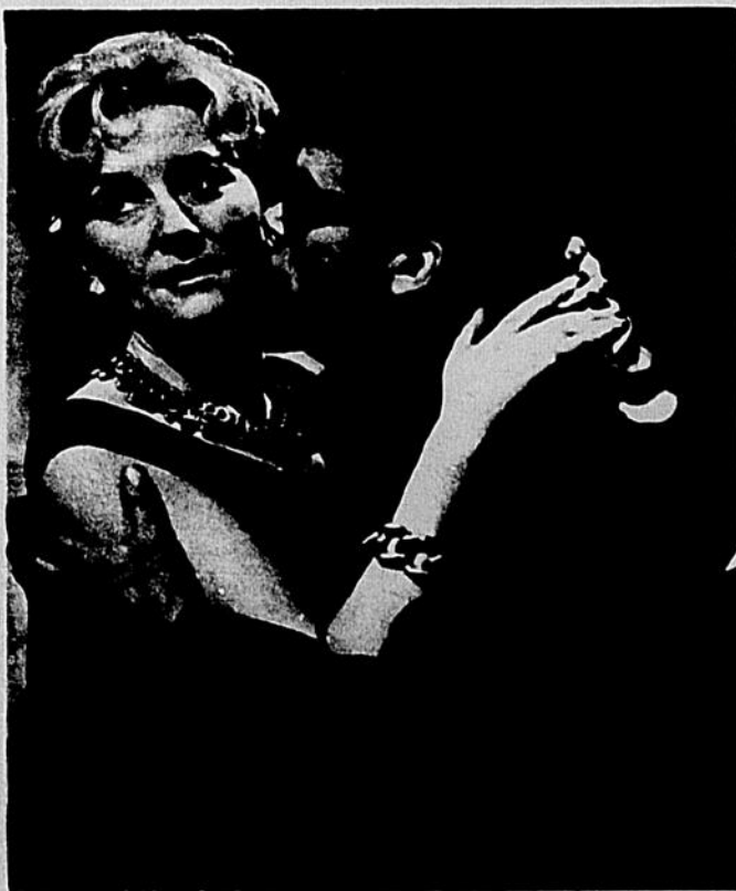
Le film polonais SALTO de Kazimierz sera présenté en première au cinéma Verdi. On ne peut que louer la politique de ce cinéma de présenter les meilleurs films contemporains.

● LE CAHIER des arts et des lettres est publié chaque jeudi par LE QUARTIER LATIN.