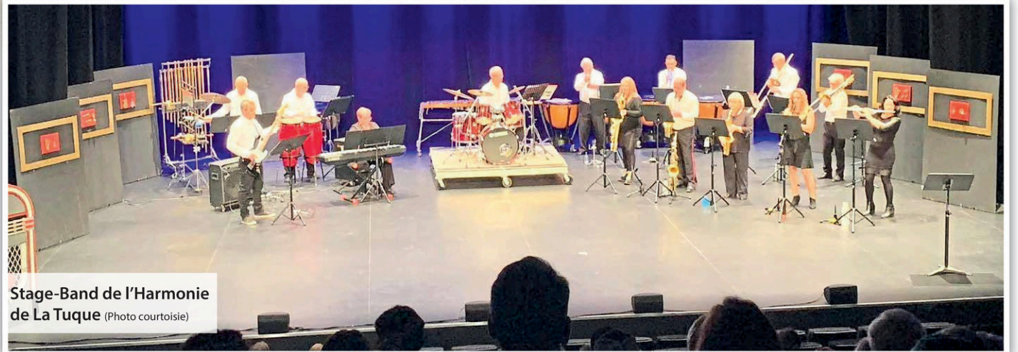
Stage-Band de l'Harmonie de La Tuque

« Notre Stage Band part de musiciens qui sont dans l'Harmonie de La Tuque. On avait le goût de faire de la musique jazz parce qu'avec l'Harmonie,