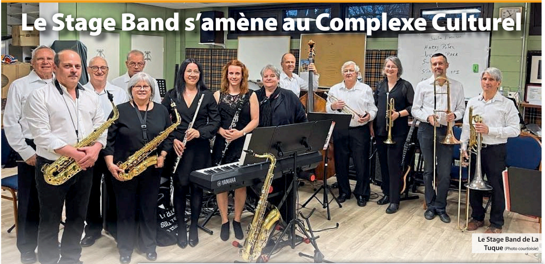
Le Stage Band de La Tuque