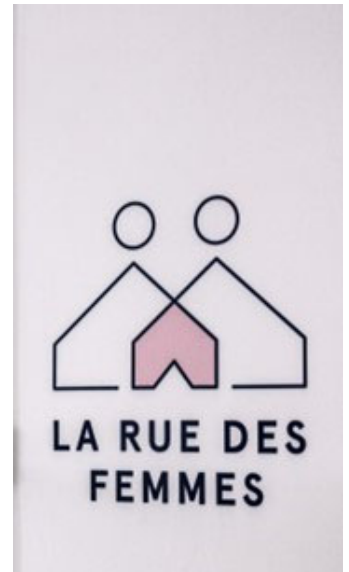
Maison Olga et Centre Dalhia https://larue.org - google

gration sociale des femmes. En septembre 2023, le centre Dahlia est devenu officiellement la maison Dorimène, afin de reconnaître la contribution exceptionnelle du Mouvement Desjardins à la Rue des Femmes.