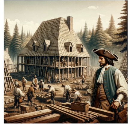
Image générée représentant la mission de Sainte-Marie-au-Pays-des-Hurons durant le 17 e siècle, montrant un site de construction animé avec des ouvriers et un homme habillé en charpentier colonial français supervisant les travaux.

charpentier, de premier colon de la Pointe-Lévy, d'interprète, de négociateur, de mari et de capitaine de milice tissent une trame narrative riche et complexe. Ce qui suit est une exploration de la vie de Couture, qui, à travers diverses époques et défis, a façonné l'histoire de la Nouvelle-France et laissé un héritage indélébile.