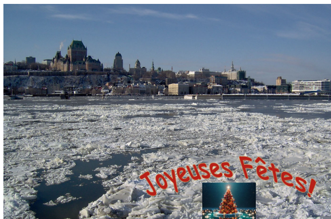
Photo prise du traversier Québec-Lévis durant l'hiver 2005. Le vieux Québec et le château Frontenac sont en arrière-plan.

Éditer et distribuer toutes formes de publications pour des fins historiques et généalogiques en vue de constituer une bibliothèque de publications au sujet de l'histoire des familles Couture. Acquérir par achat, prêt ou location des archives au sujet de Guillaume Couture.