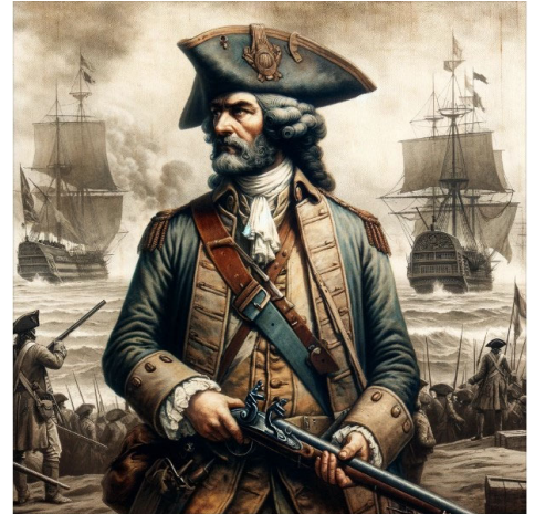
Image générée, représentant Guillaume Couture en tant que capitaine de la milice pendant la bataille contre les troupes de Phips.

En 1690, alors que la colonie de la Nouvelle-France fait face au siège britannique de Québec, Guillaume Couture, alors âgé de 73 ans, joue un rôle de défenseur en tant que capitaine de la milice de la côte de Lauzon. Sous