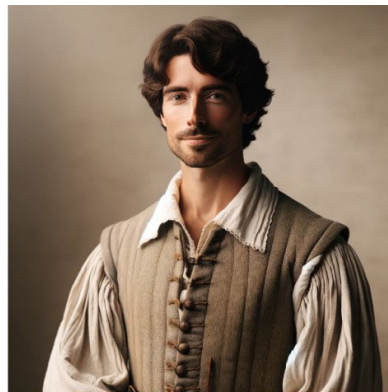
Portrait généré qui pourrait représenter Guillaume Couture, un homme de la Nouvelle-France du XVII e siècle. Il est habillé de vêtements de l'époque, ce qui illustre son statut de figure importante de cette période coloniale au Canada.

Guillaume Couture, menuisier et charpentier de métier, pose le pied en Nouvelle-France en 1637, en quête d'aventure et de nouvelles opportunités. Peu de temps après son arrivée, son savoir-faire et sa détermination le mènent à la mission de Sainte-Marie-au-Pays-des-Hurons. Là, il déploie ses compétences pour ériger cette importante mission jésuite, devenant ainsi un acteur clé dans la construction des premiers liens solides entre les colons et les peuples