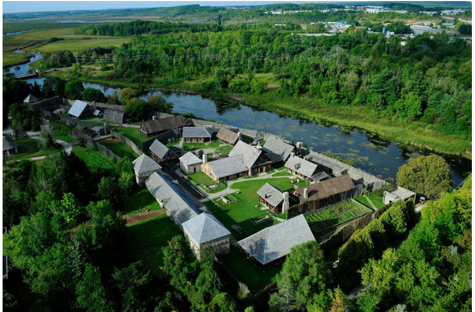
Photo du site de Sainte-Marie au pays des Hurons, reconstruit durant les années 1960: ( www.saintemarieamongthehurons.on.ca )

À certaines occasions des personnes, qui marquèrent notre histoire ont séjourné dans la communauté. L'un des plus célèbres coureurs des bois, Médard Chouart