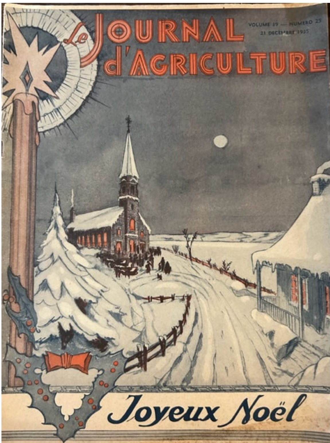
Couverture de la revue : Le Journal d'Agriculture volume 39, numéro 25, publié le 21 décembre 1935.