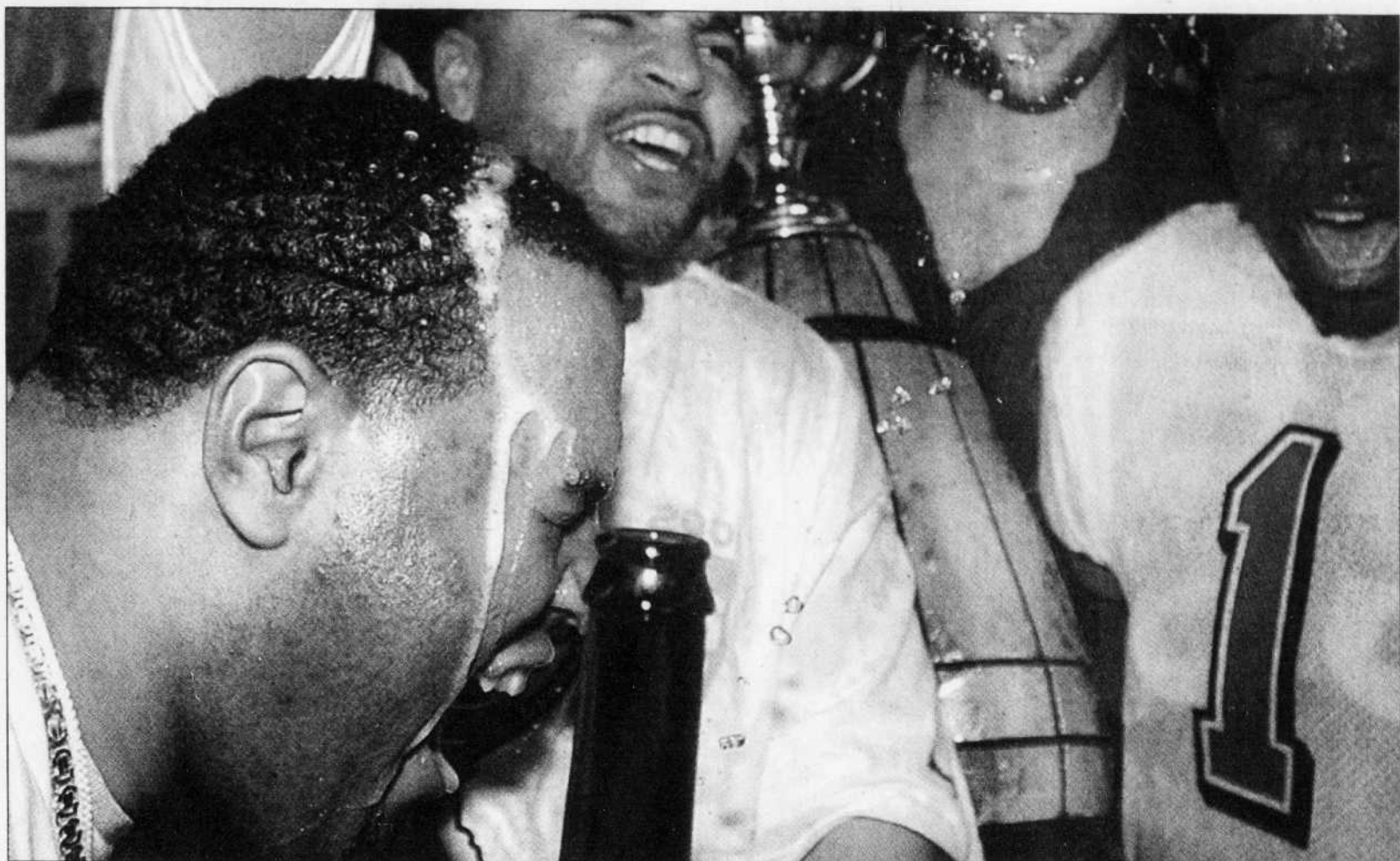
Le champagne coulait à flot dans le vestiaire des Stampers de Calgary hier soir au Stade olympique de Montréal. Les joueurs venaient de réaliser l'improbable en défaisant par la pointage de 27 à 19 la meilleure équipe de la LCF cette saison, les Blue Bombers de Winnipeg, lors du match de la coupe Grey.