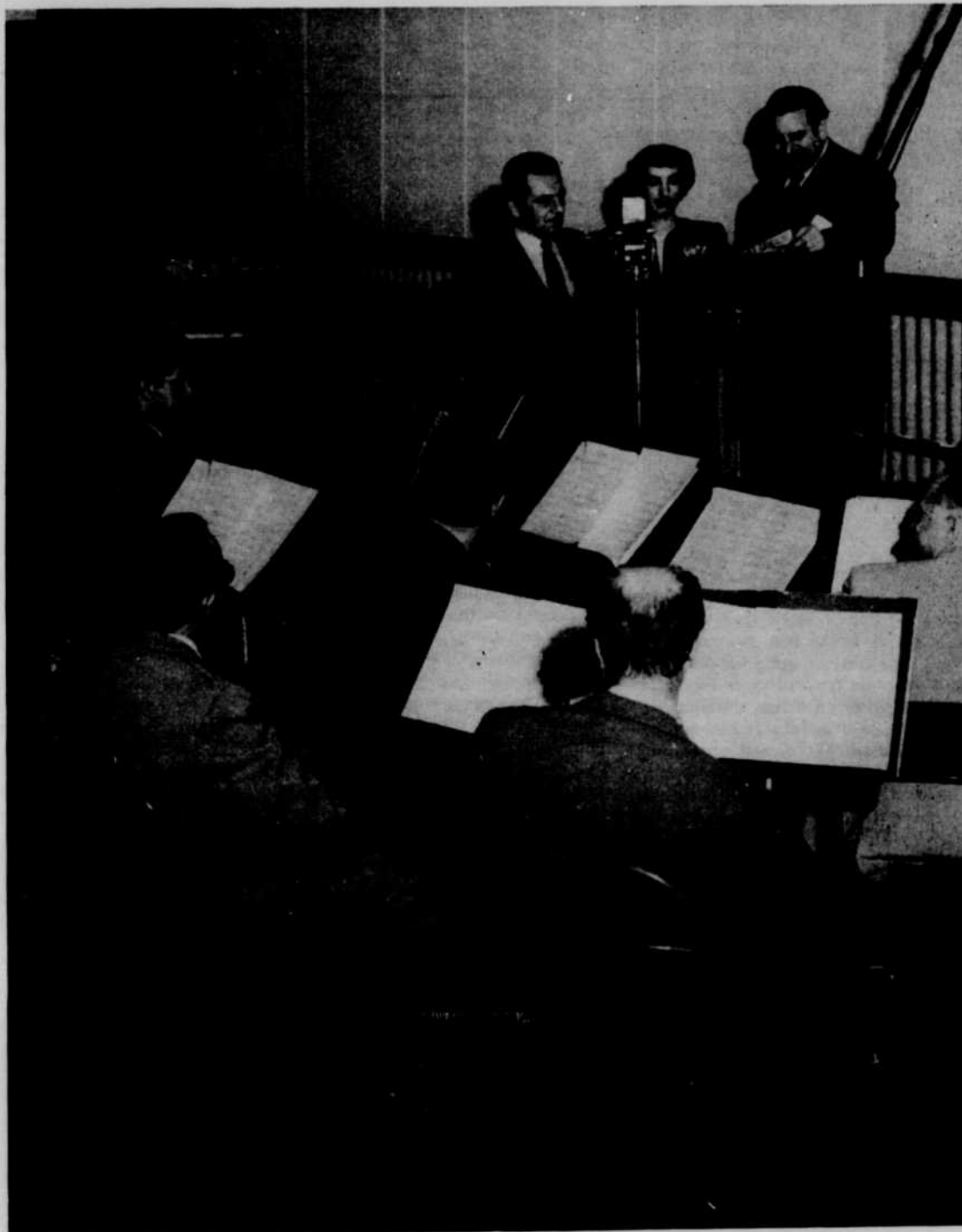
La répétition d'un tour de chant au réseau Français

Parmi les autres émissions en direct que Radio-Canada consacre à la chansonnette, mentionnons Baptiste et Marianne , chaque jeudi soir, à 8 h. 30, Tambour battant et La Chanson de l'Escadrille , cinq fois la semaine, à 7 h. 30 du soir, Les Collégiens , entendus de Québec, le mardi à 6 h. 30 etc., etc.