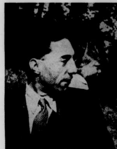
LUIGI DALLAPICCOLA que l'on voit ici avec sa petite fille.

Gianni Schicchi , qui fut créé au Metropolitan Opera de New-York en 1918, est une brillante comédie inspirée par un passage de Dante. Le riche Buoso Donati vient de mourir entouré de ses parents. Tout ce monde pleure et se lamente jusqu'à la découverte du testament de Buoso qui lègue tous ses biens aux monastères. La parenté change alors d'opinion sur Buoso. Le rusé Gianni