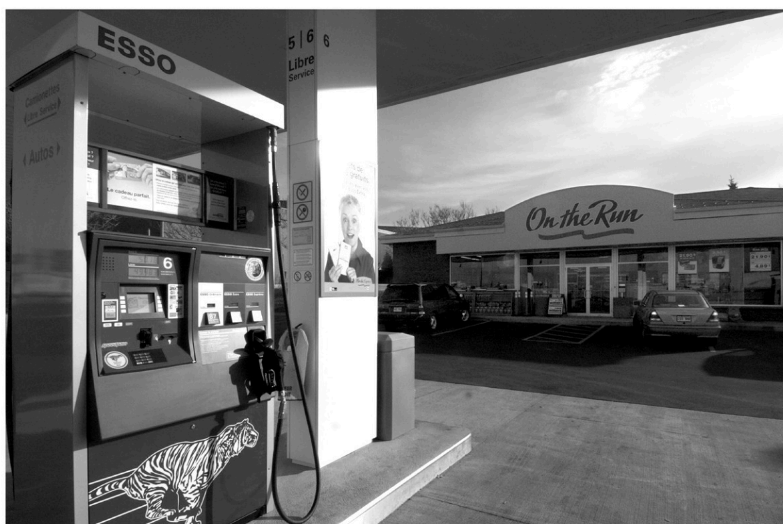
La plupart des stations que Couche-Tard achète sont situées en Ontario bien qu'elle en acquière une cinquantaine au Québec.