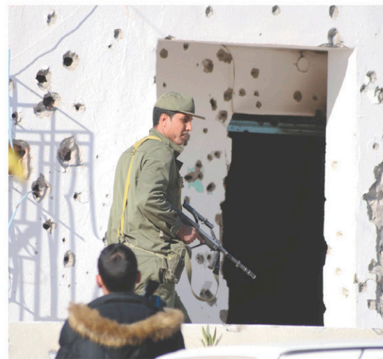
Un policier s'est rendu mardi sur les lieux de l'attaque de la veille.

L'évolution en Libye pourrait avoir pris ce plan de court, en particulier le raid américain mené le 19 février contre un centre d'entraînement du groupe EI à Sabrata, ville de l'ouest libyen distante d'à peine 100 kilomètres de la frontière. Une cinquantaine de djihadistes, dont nombre de Tunisiens, ont été tués dans ce bombardement. Cinq jours plus tard, 200 djihadistes ont occupé, durant quelques heures, le centre de Sabrata, avant d'en être chassés par