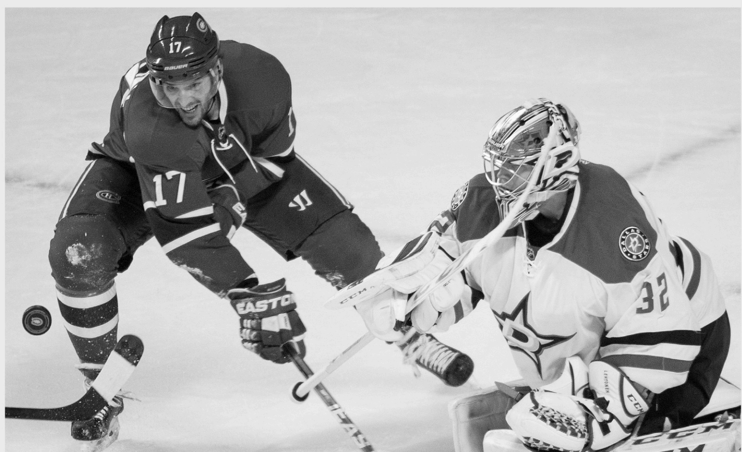
GRAHAM HUGHES LA PRESSE CANADIENNE