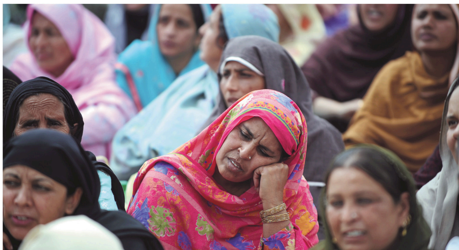
Les chances pour les femmes d'entrer sur le marché du travail sont inférieures de 27 % à celles des hommes, selon l'Organisation internationale du travail.

Les progrès réalisés en matière d'éducation n'ont pas trouvé d'échos sur le marché du travail, constate l'OIT