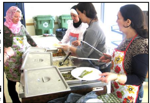
Bénévoles du repas communautaire