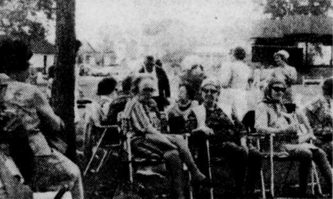
Il fait bon profiter d'une belle après-midi de soleil, sur la plage...

La prochaine joute dans cette ligue sera le 25 juin, à 19 heures, au parc Dufresne à Sherbrooke alors que le Sherbrooke rencontrera le Sherbrooke est.