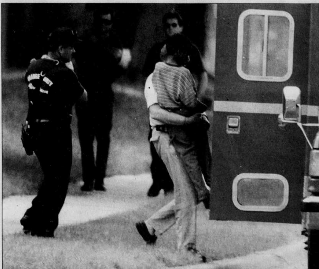
Deux enfants ont été libérés ce week-end dans la prise d'otages d'Orlando, en Floride.