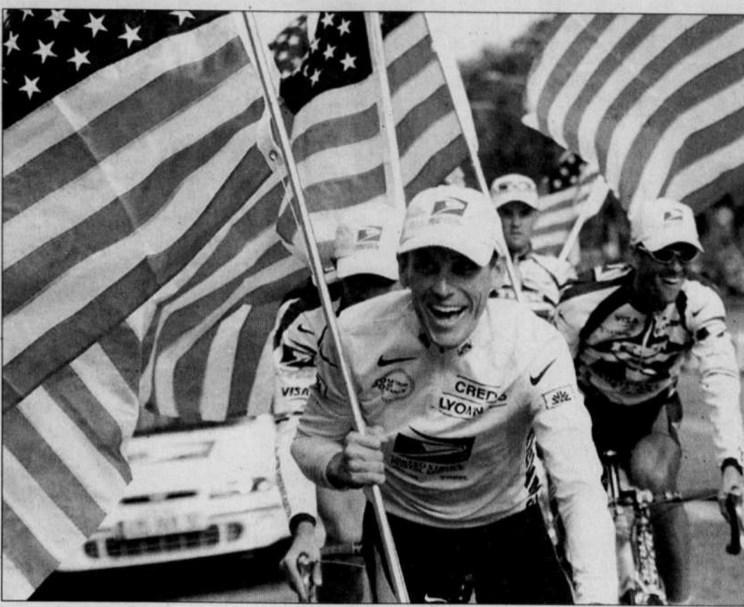
La victoire de Lance Armstrong a été l'occasion de faire parader les drapeaux américains.

Cent vingt-huit coureurs sur les cent soixante-dix-sept partis du Futuroscope le 1 er juillet, ont rallié Paris, au terme des 3662 kilomètres de l'épreuve qui a retrouvé une très grande audience auprès du public.