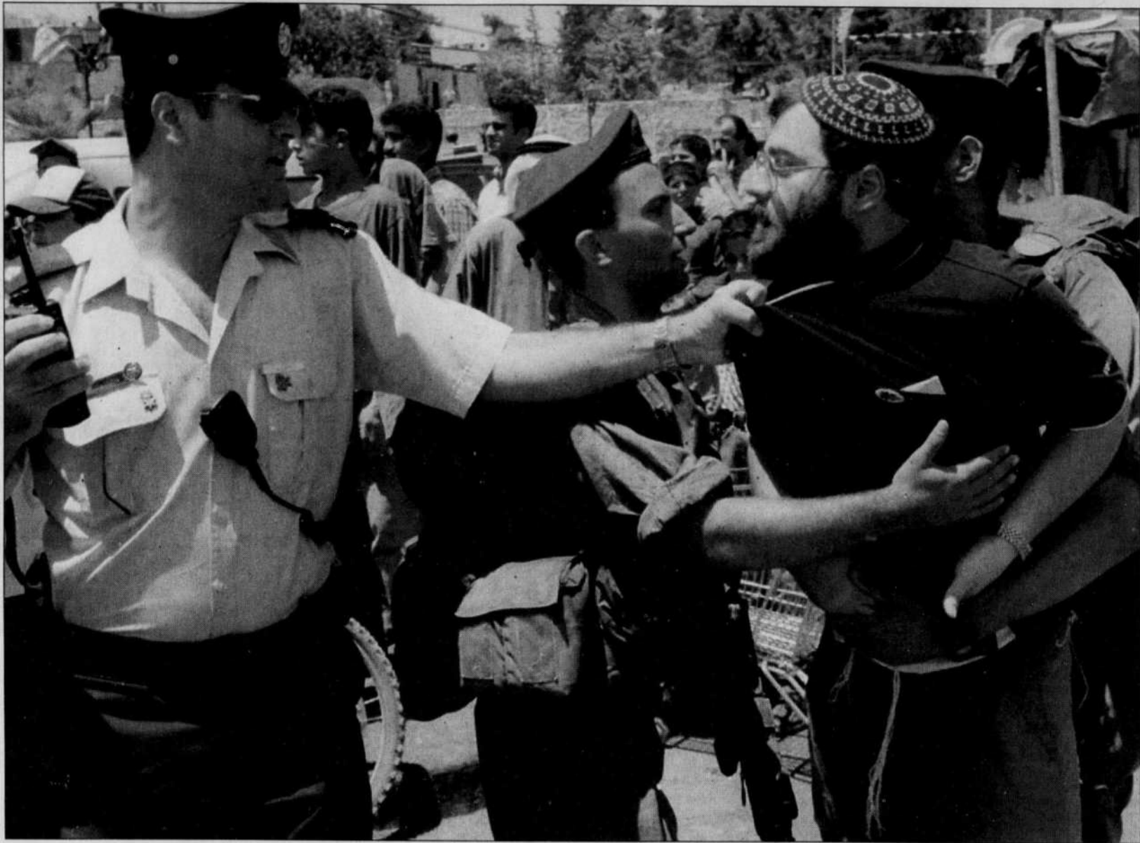
Si les négociations de paix à Camp David semblent tourner en rond, à Hébron, en Cisjordanie, au grand dam des Israéliens, Palestiniens et Américains, les colons juifs ultra-orthodoxes manifestent, eux, régulièrement pour qu'elles n'aboutissent pas du tout.