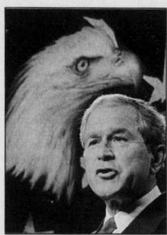
George W. Bush

M. Bush a souligné par ailleurs que son analyse sur l'Irak de Saddam Hussein était partagée par des parlementaires des deux partis, des membres du Conseil de sécurité de l'ONU et même par le gouvernement démocrate de l'ancien président Bill Clinton. Et il a relevé que, dès la présidence de Clinton, la politique officielle américaine envers ce pays visait