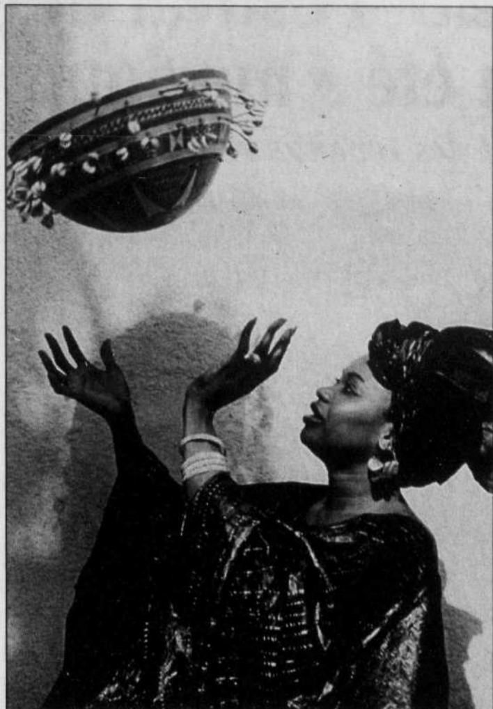
Oumou Sangaré est la diva des Maliens.

Celle qu'on surnomme «l'oiseau chantant» est aussi une fière militante des droits de la femme. Depuis le tout début de sa carrière, elle se sert du micro pour dénoncer l'excision, la polygamie, la misère des femmes qui sont abandonnées et doivent élever seules leurs enfants. Entre les tournées et le temps passé avec son petit garçon qu'elle élève avec un conjoint apparemment plus libéral que d'autres, Mme Sangaré se balade maintenant en Afrique comme ambassadrice de la FAO. Quant à sa musique, quelles que soient les difficultés, «elle exprime la joie», lance-t-elle en riant. Oumou Sangaré ne présente qu'un seul concert, ce soir à 21h30, à Place d'Youville.