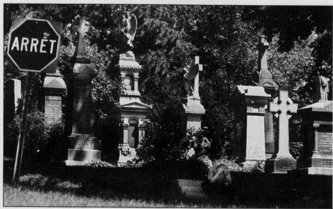
Avec ses 5600 inhumations par année, ses 900 000 monuments funéraires et ses 343 hectares de superficie, NDN constitue le plus grand cimetière du pays