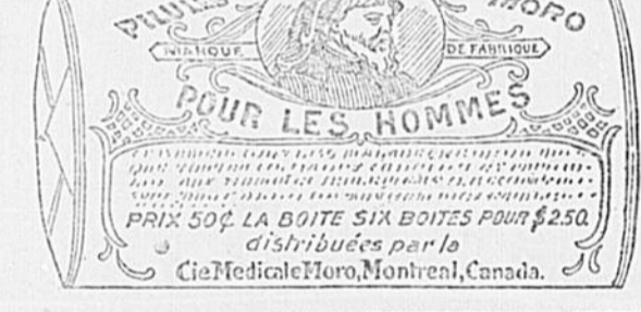
Façon Similité d'une boîte de Pilules Moro.