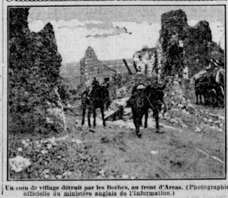
Un coin de village détruit par les Boches, au front d'Arras.