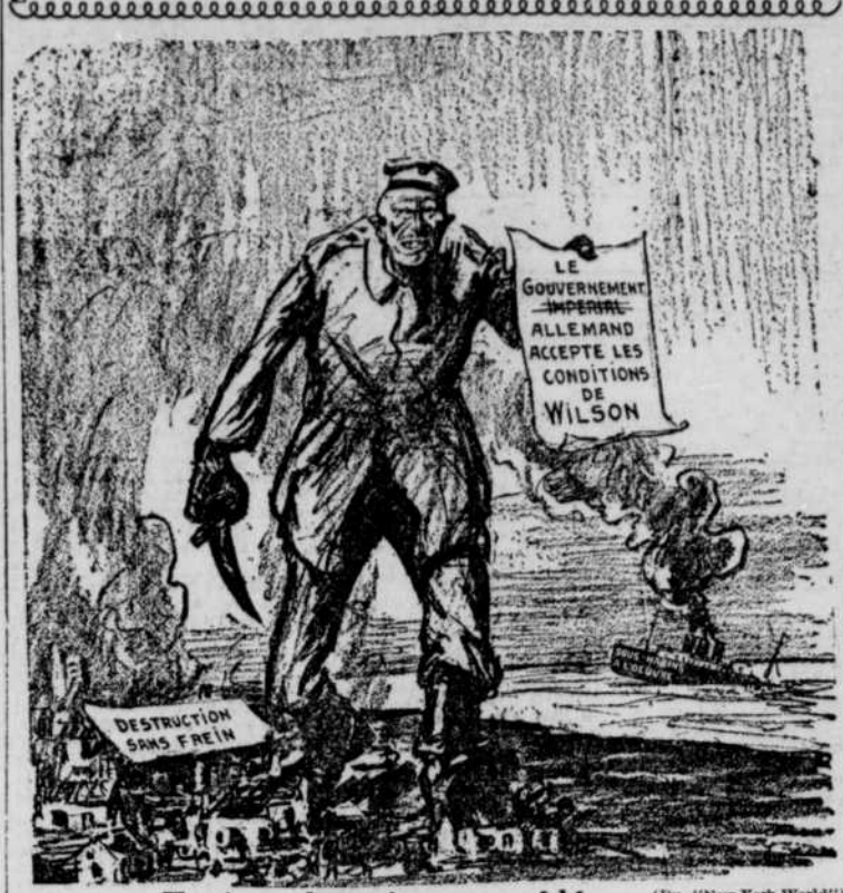
Toujours les mêmes procédés.