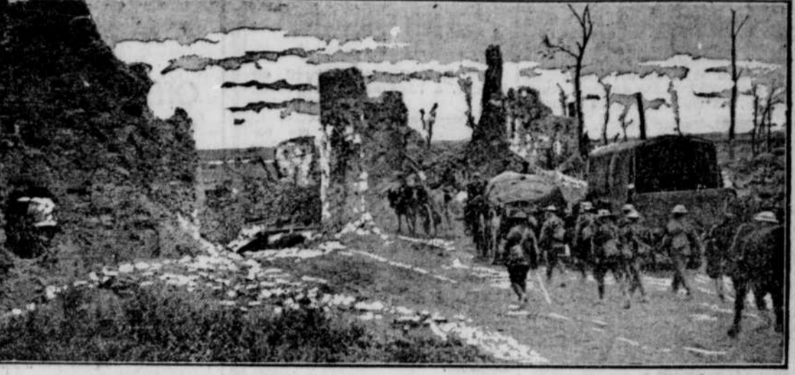
L'infanterie canadienne accompagnée du service de transport passant à travers un village repris à l'ennemi, au front d'Arras.

Les nôtres à travers un village fièrement reconquis