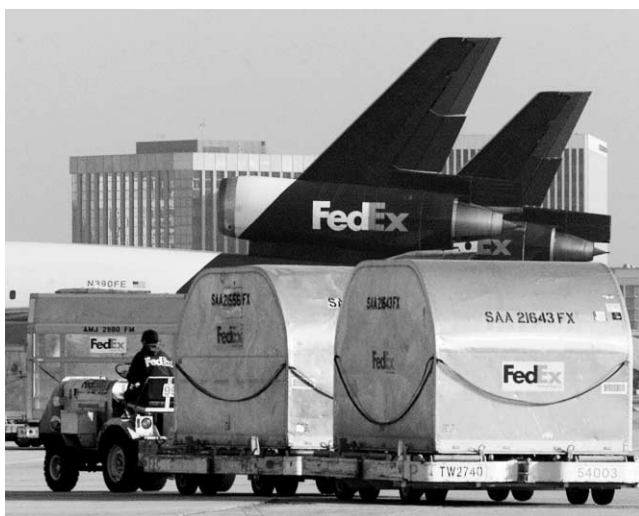
Conteneurs et avions de FedEx.

LES ÉCOLOGISTES et les politiciens républicains se disputent au sujet d'un projet de loi actuellement devant le Sénat américain. Le projet veut limiter progressivement les émissions d'oxyde nitreux (NO) et de dioxyde de soufre (SO 2 ) des centrales thermiques, en comptant que les mesures entraîneront également une baisse des émissions de mercure. Chaque année, les centrales thermiques au charbon américaines émettent 48 tonnes de mercure dans l'atmosphère. À l'origine, on croyait que ces émissions pourraient être réduites à 26 tonnes en 2010 et à 15 tonnes en 2018. Mais de nouvelles analyses présentées par l'administration Bush montrent que ces objectifs ne pourront être atteints, loin de là : on passerait plutôt à « entre 34 et 46 tonnes » en 2010. L'industrie affirme que la technologie de réduction des émissions n'est pas au point et certains républicains sont prêts à assouplir les exigences. Les écologistes affirment qu'on leur sert le même argument depuis 40 ans. La pollution au mercure, qui peut affecter gravement le système nerveux, touche près de 40 États au sud de la frontière. — Source : ENS