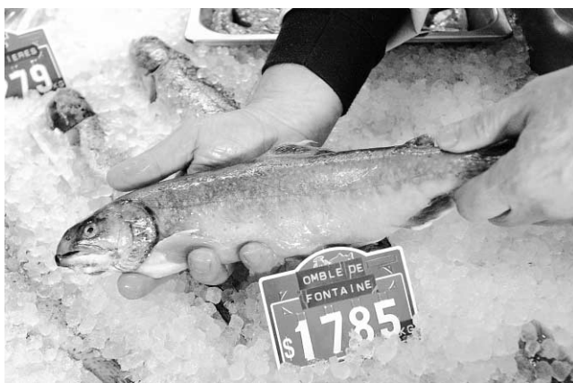
Le mercure contamine la chaîne alimentaire.