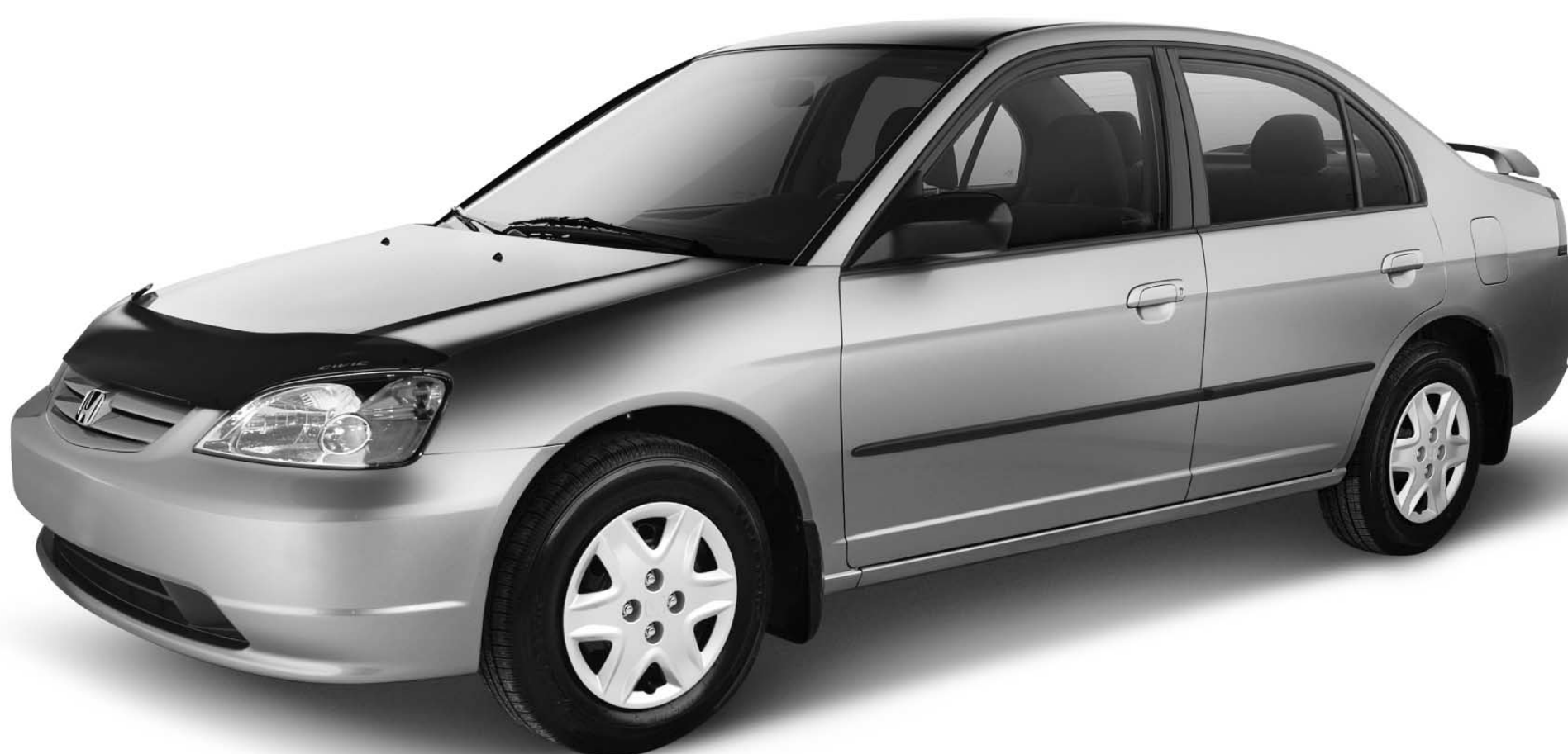
Civic Édition 30 e Anniversaire