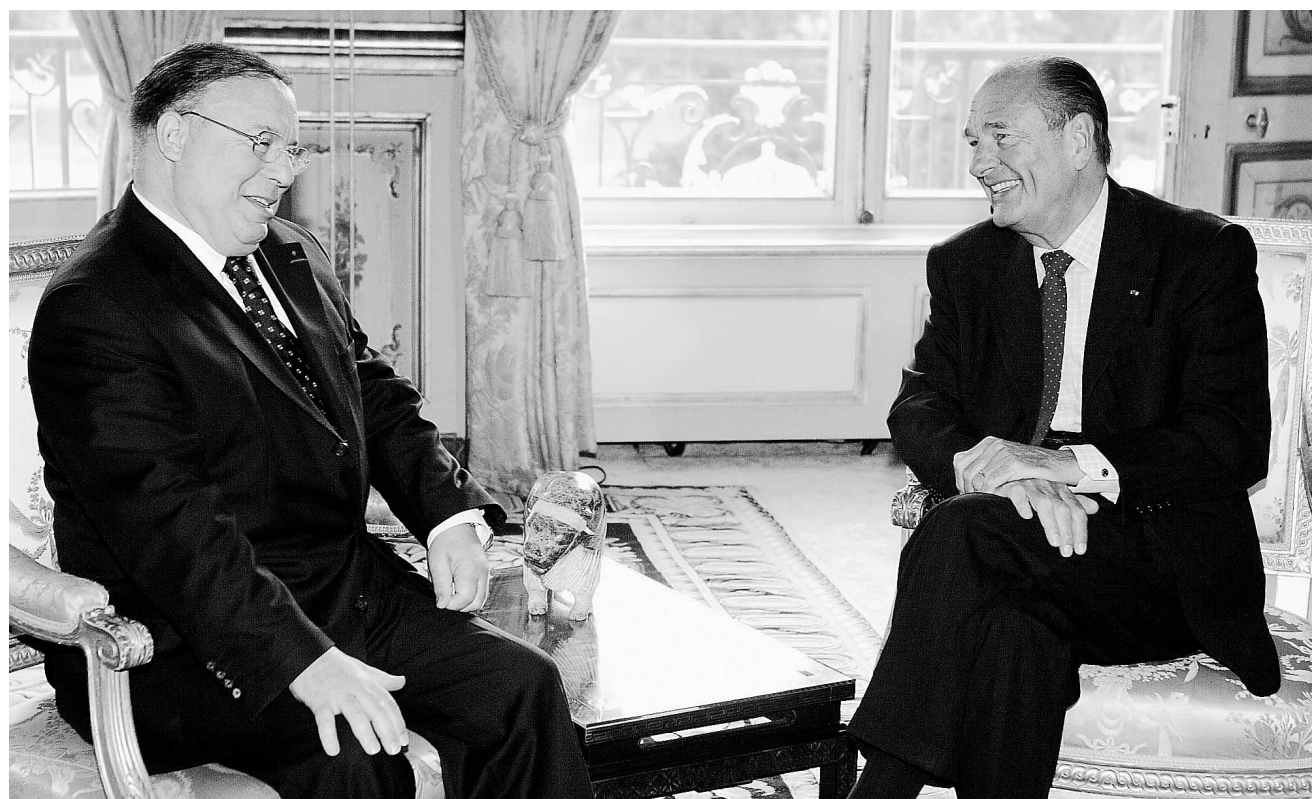
Le recteur de la Mosquée de Paris, Dalil Boubakeur, accueilli à l'Élysée en mai dernier par le président de la République française, Jacques Chirac.