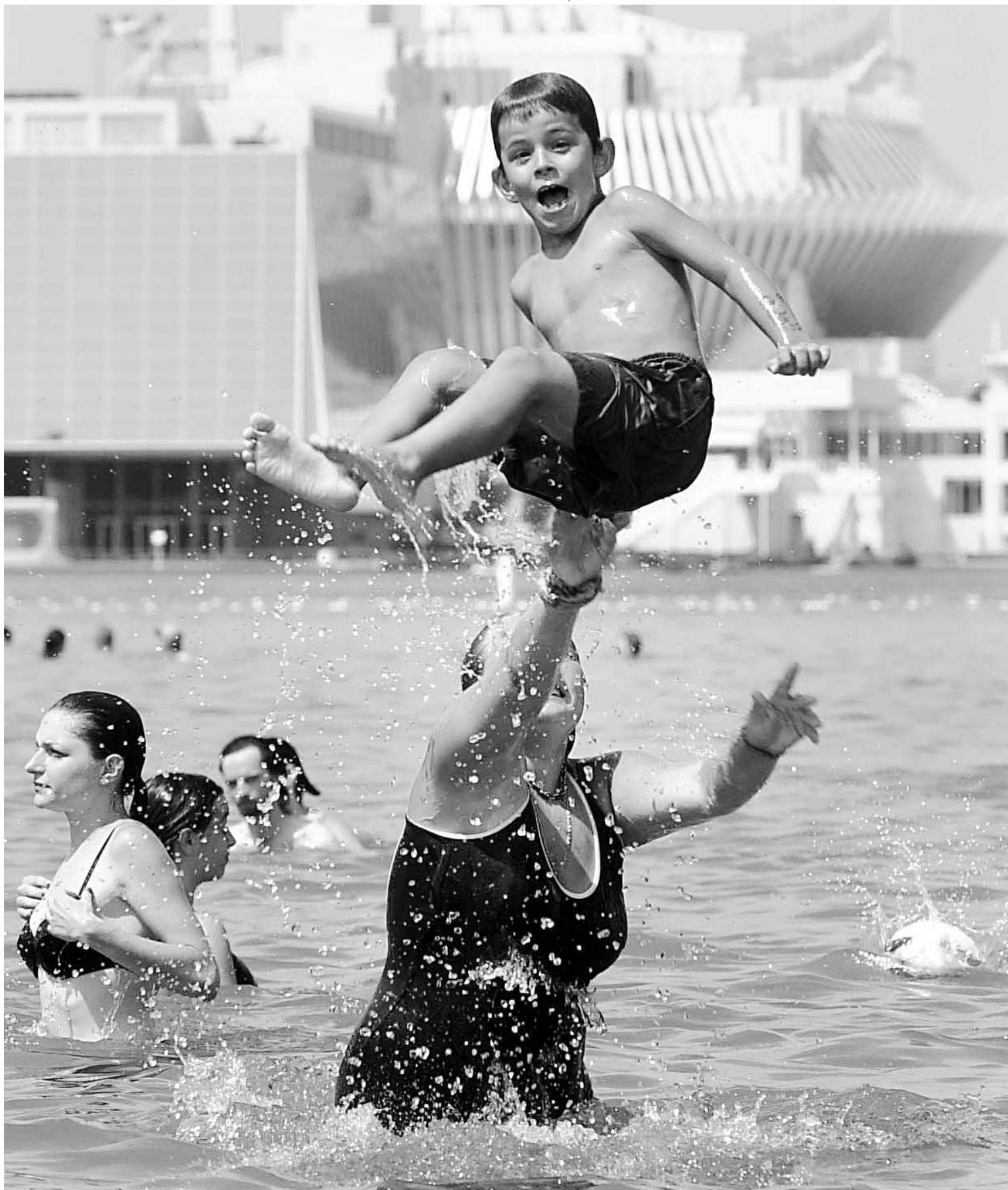
Le plaisir à la plage, c'est la santé!