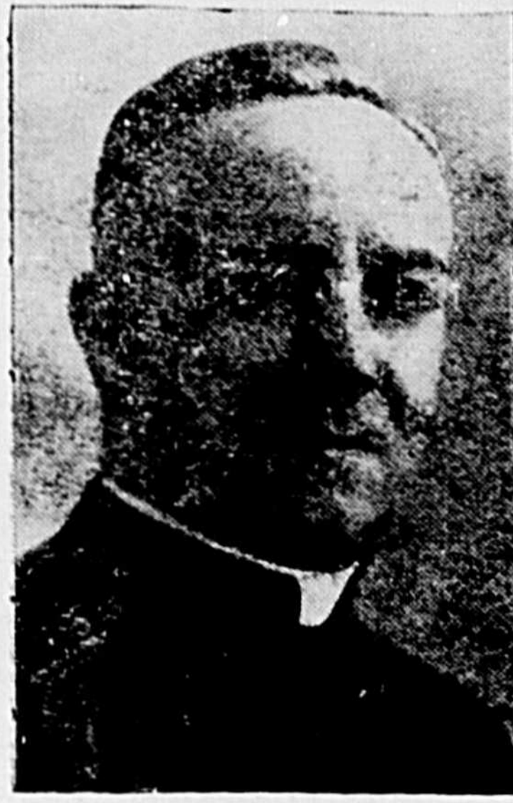
Le 27ème banquet annuel des "Anciens de Bourget" au Collège Bourget de Rigaud

aura lieu mercredi prochain, le 5 février, en l'Hôtel Windsor, à 7 hres 30.