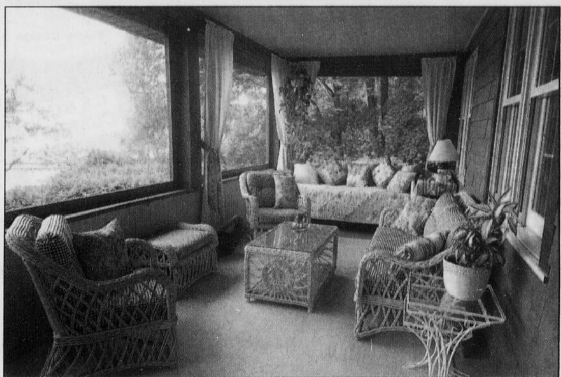
Imacom, Jocelyn Riendeau

Pour plus d'informations, ou pour réserver, téléphonez au 819-842-2431.