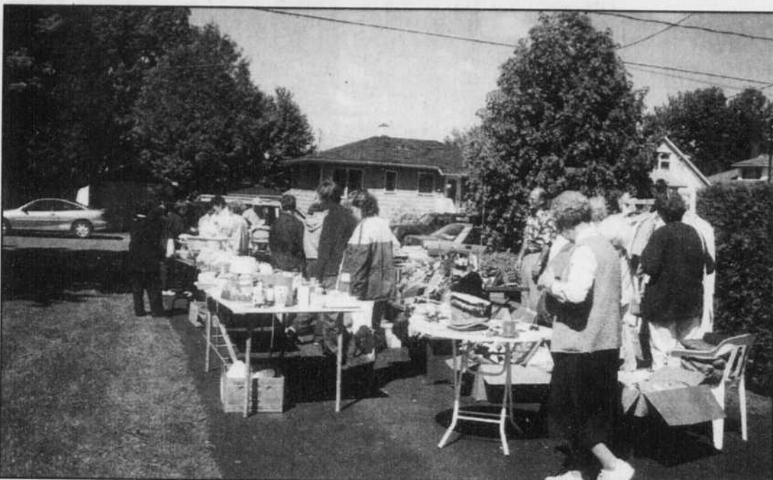
La fin de semaine annuelle des ventes de garage a remporté un vif succès à Richmond alors que plusieurs centaines de visiteurs ont envahi les rues de la municipalité en quête de la meilleure aubaine.

«C'est devenu un happening familial et en plus de faire quelques sous, l'achalandage provoqué par cette activité comporte un impact économique non négligeable pour certains commerces de la Ville. Qu'on pense aux restaurants, dépanneurs, vendeurs d'essences et autres», a-t-il ajouté.