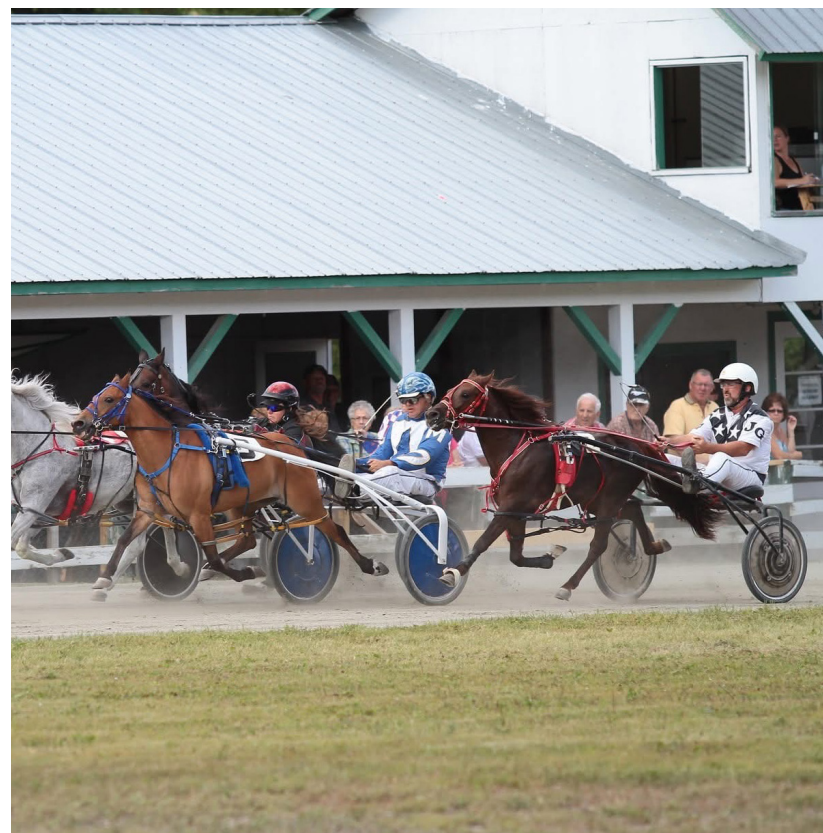
Des conducteurs s'élançant sur la piste avec leur cheval.

La piste de courses de chevaux de Kiamika s'apprête à trembler pour la 50 e année consécutive! Retour sur un rassemblement de passionnés qui garde le cap.