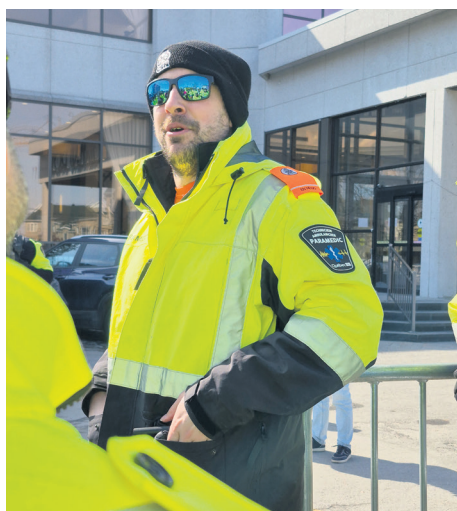
Les Paramédics ont tenu un rassemblement à Mirabel, le 1er avril, dans le secteur Saint-Janvier.

«Nos conditions de travail (dont les salaires) ne tiennent pas la comparaison avec les autres professions: ni dans la santé et les services sociaux ni en