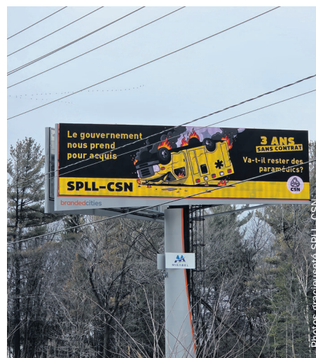
Le SPLL–CSN sensibilise les automobilistes avec des panneaux d'affichage.

«Depuis 2015, les protocoles et médicaments ont été modifiés. Il y a des enjeux de tâches: il existe dans d'autres régions des projets pilotes (qui vont arriver ici) et qui résultent par un revirement de l'approche, comme l'administration de morphine et autres médicaments dans des cas précis. Or, on nous dit de prendre la formation pendant nos temps