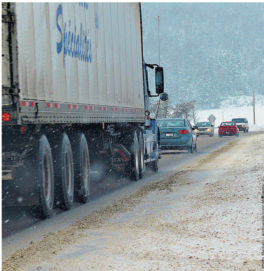
La route 117, grande récipiendaire de travaux du MTMD entre 2026 et 2028.