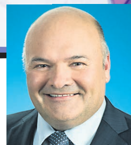
Pierre Giguère Député de Saint-Maurice Membre du bureau de l'Assemblée nationale