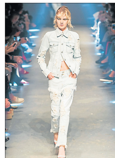
Versus - Versace