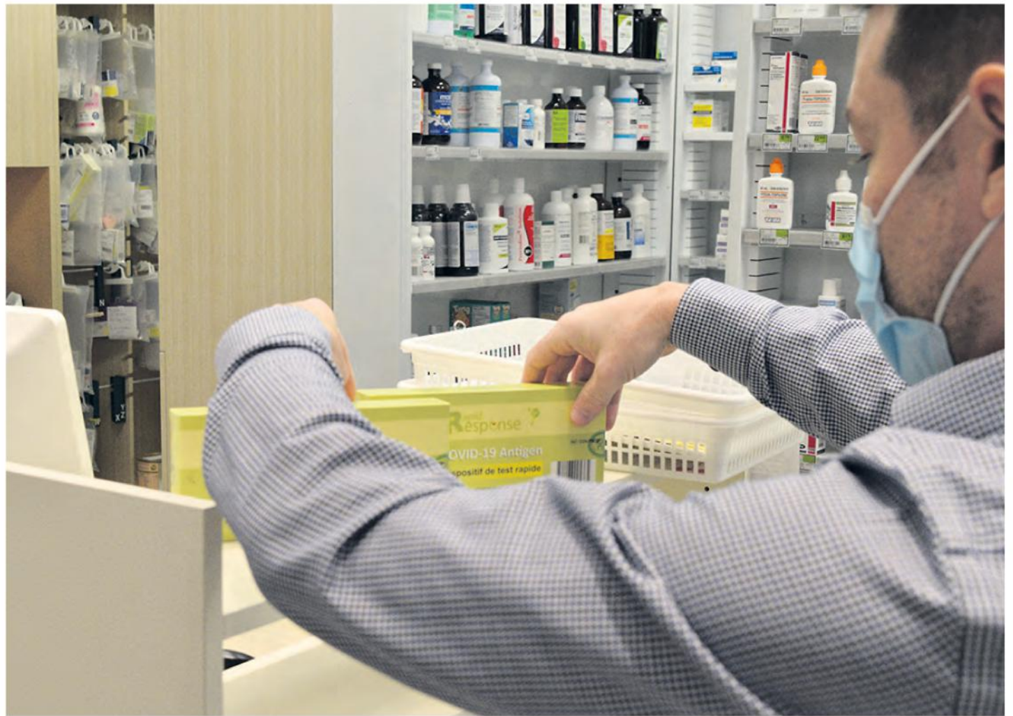
Il ne manque désormais plus de tests rapides en pharmacie, contrairement à il y a quatre mois.

Au sujet du personnel, Viviane, qui travaille également dans le même établissement,