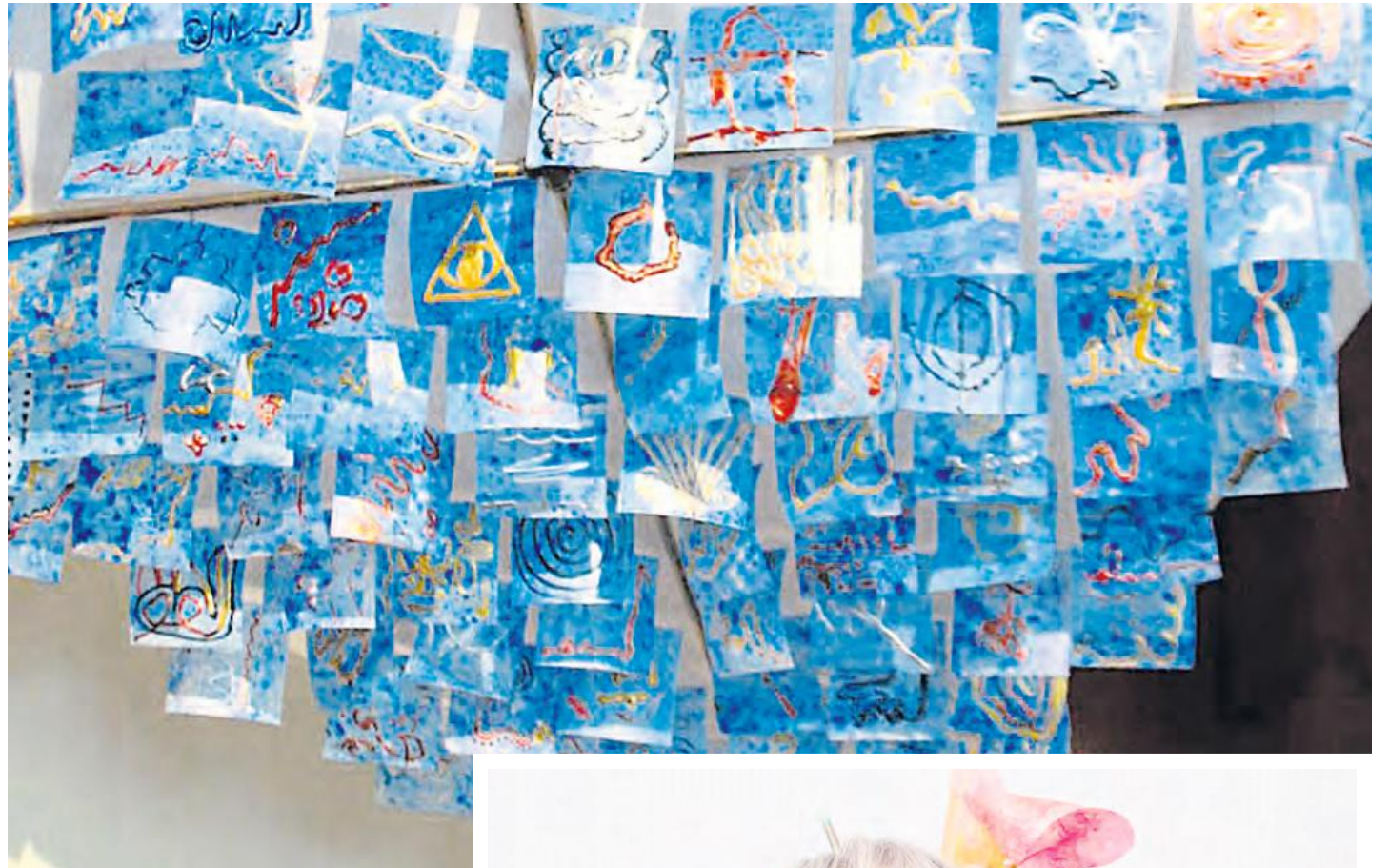
Une des œuvres de l'exposition composée représentant le chemin de vie de chacune des personnes ayant participé.

La bourse obtenue par Mme Lalonde permettra de faire voyager son exposition de Saint-Basile-le-Grand, du 14 au 22, à la