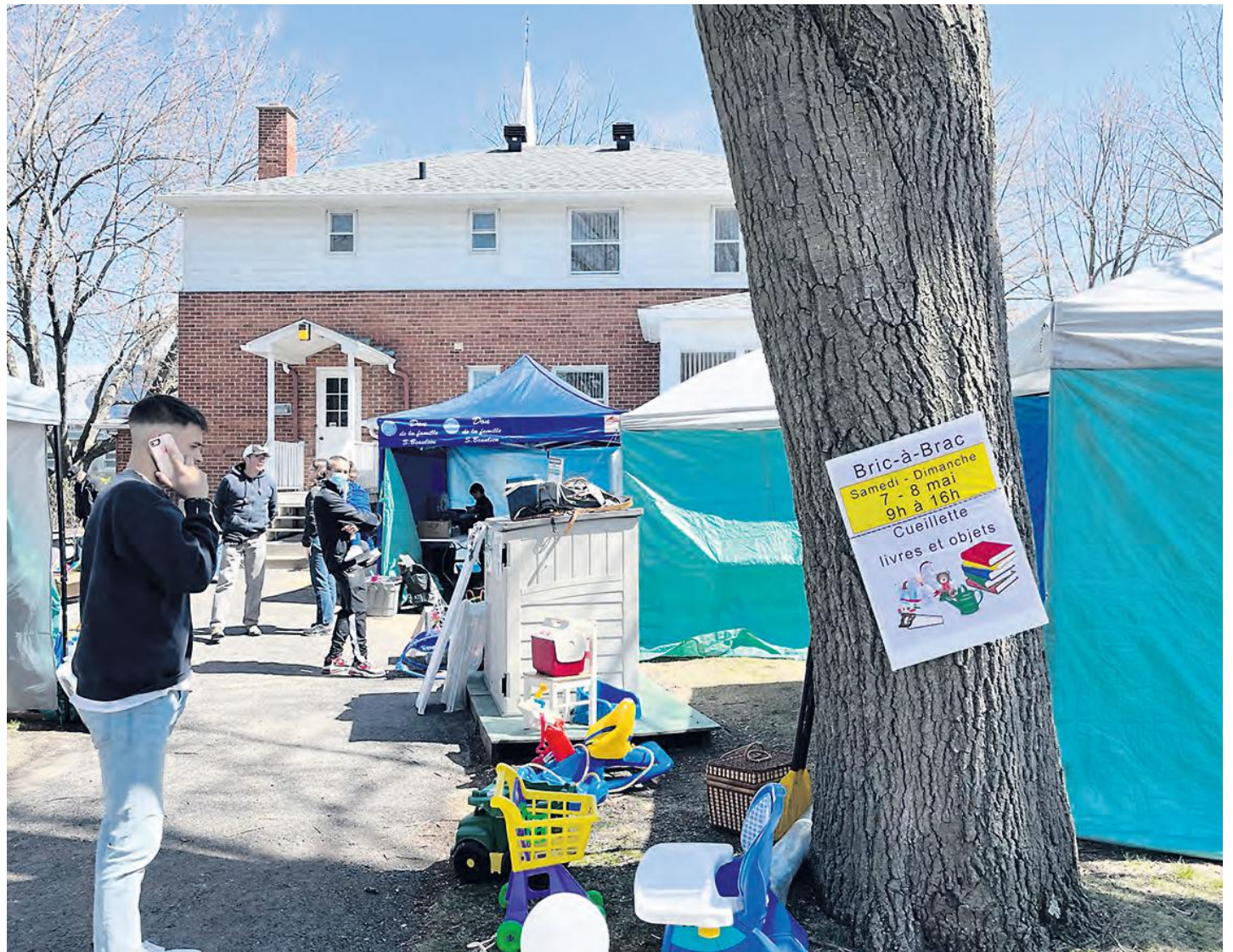
Les acheteurs étaient à nouveau au rendez-vous pour cette autre édition des Trouvailles du printemps de Saint-Basile-le-Grand.

En 2019, 177 personnes avaient annoncé qu'elles tiendraient un kiosque à leur résidence dans le cadre de la fin de semaine de ventes. En 2012, elles étaient 184 à s'être inscrites. Il en demeure néanmoins que plu-