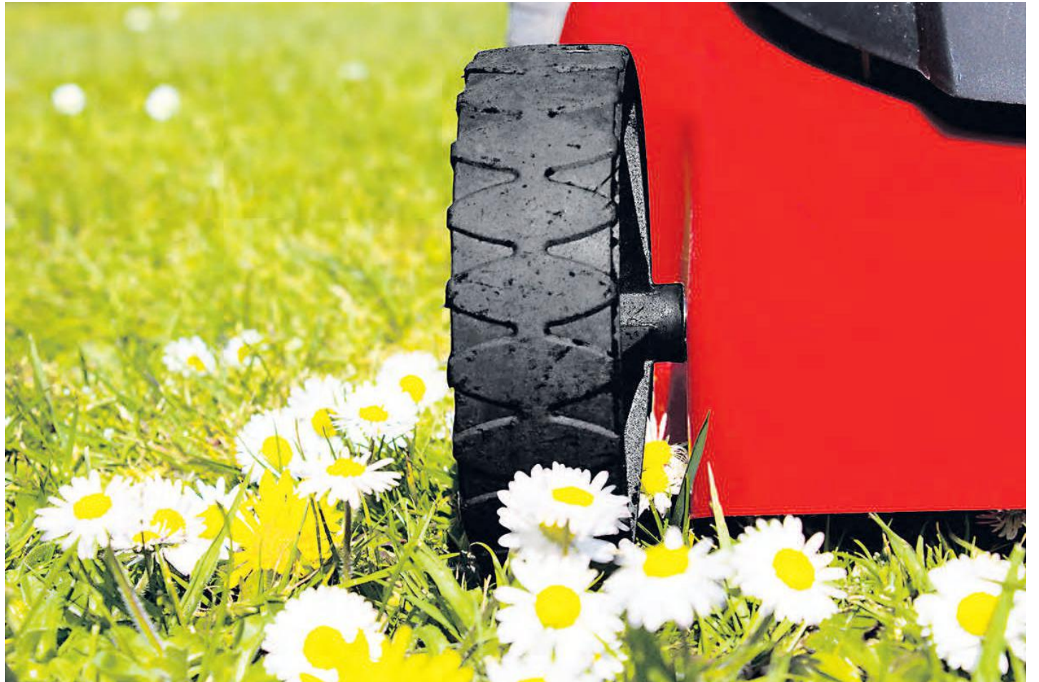
La réglementation sur le bruit est contestée à Saint-Basile-le-Grand.

À Saint-Bruno-de-Montarville, les citoyens peuvent utiliser des appareils ou instruments munis ou non d'un moteur, comme une tondeuse à gazon, entre 7 h et 21 h, du lundi au vendredi. Or, la fin de semaine, le règlement est moins souple : entre 9 h et