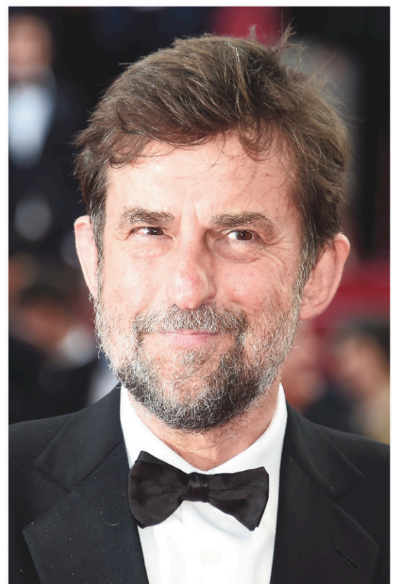
Nanni Moretti est considéré par plusieurs comme le Woody Allen italien.