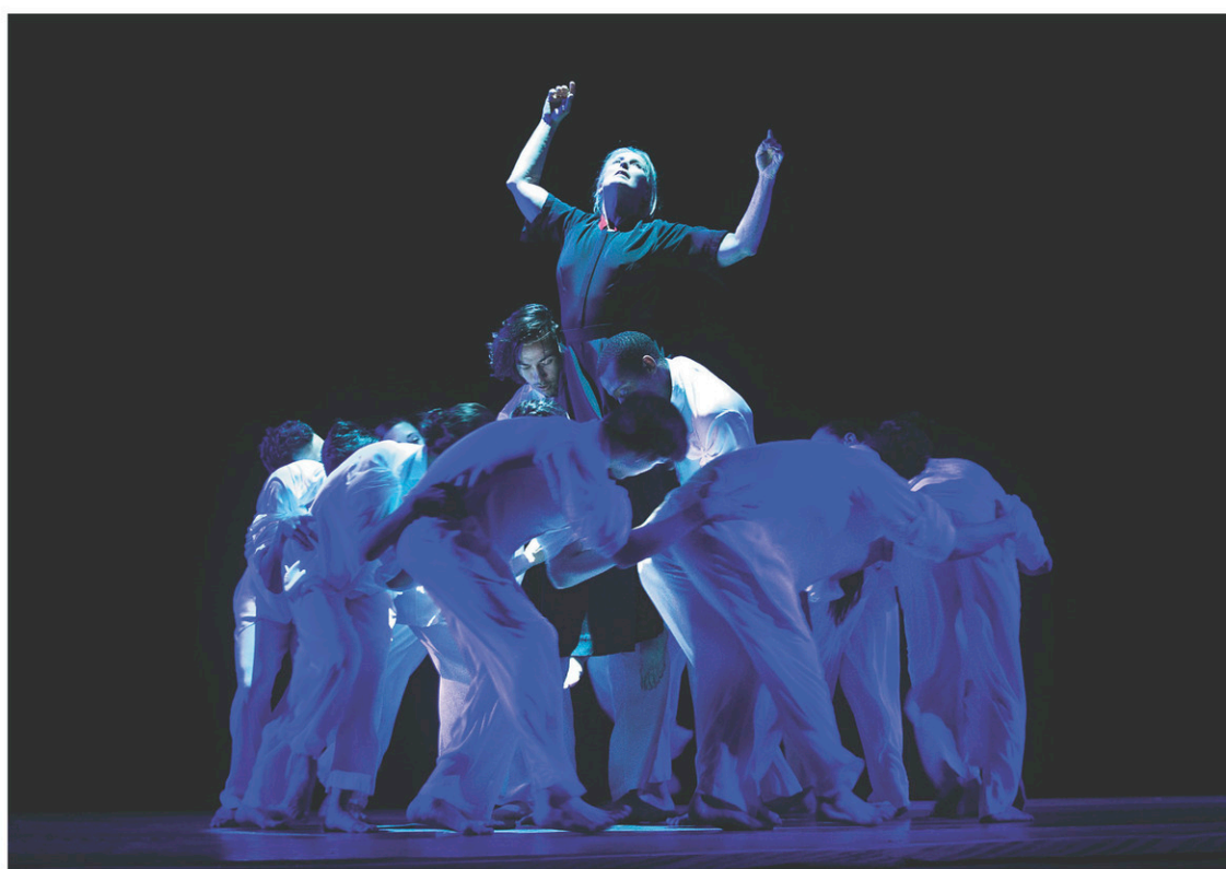
Pearl , un spectacle passant d'un kitsch visuel parfois irritant à des tableaux superbes

Ce spectacle, passant d'un kitsch visuel parfois irritant à des tableaux superbes, avec chorégraphies souvent remarquables, marie les influences chinoises et occidentales. Il commande aussi au spectateur d'avoir potassé la vie de Pearl Buck (deux maris, une fille handicapée, une fondation pour les enfants métissés abandonnés, maintes carrières, etc.), sous