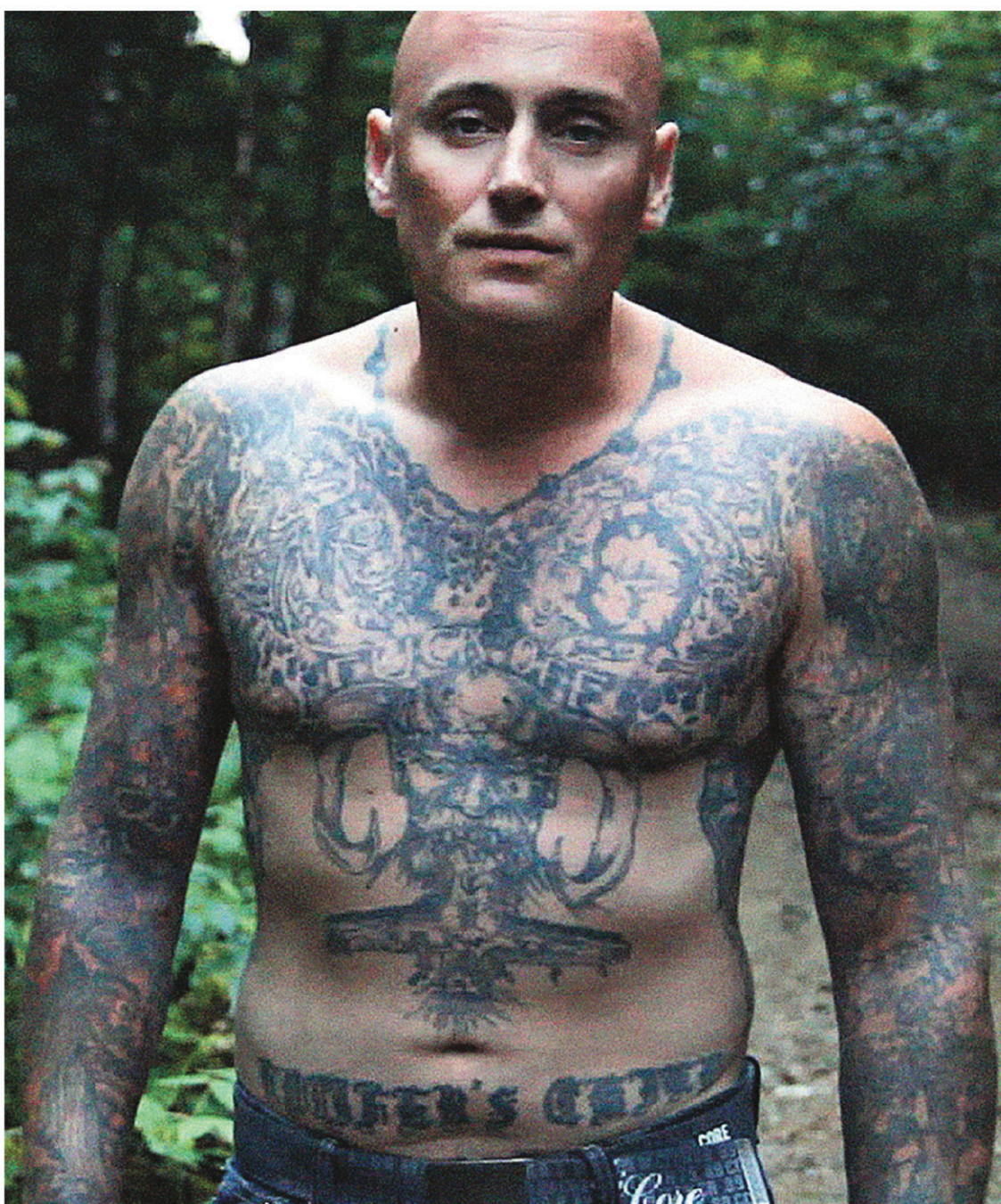
EYE STEEL FILM

Un remarquable documentaire qui aborde le sujet sans diaboliser ou ridiculiser