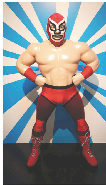
MUSÉE QUÉBÉCOIS DE CULTURE POPULAIRE DE TROIS-RIVIÈRES

Didactique. L'art de la bande dessinée québécoise l'est sans l'ombre d'un doute en dressant