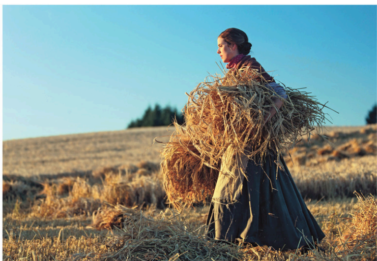
CINÉMA DU PARC

Sunset Song est aussi le délicat portrait d'une jeune fille farouchement indépendante.