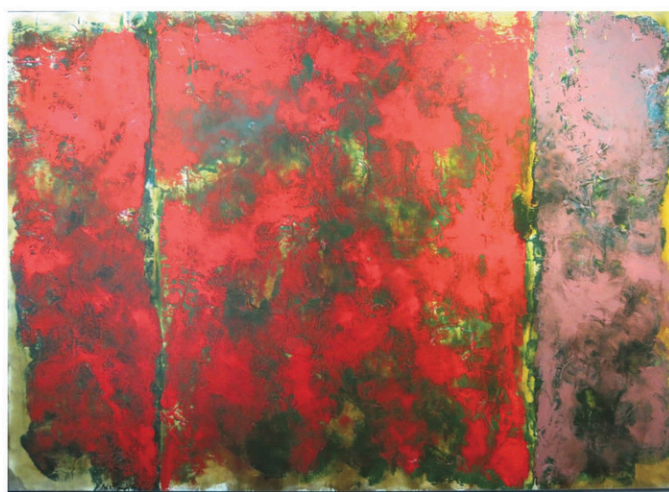
Jean McEwen, "Cages d'île n°3"

Importante exposition Maîtres Québécois : Alleyn, Ferron, Gagnon, Hurtubise, Lemieux, McEwen, Riopelle, Suzor-Côté