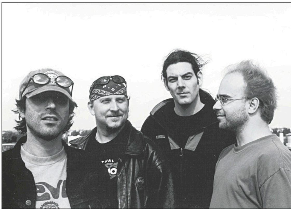
Groovy Aardvark en 2001