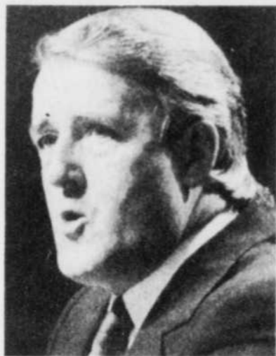
Brian Mulroney a reconnu le droit à la dissidence de Mme Thatcher

Mulroney et Thatcher Ils ont décidé d'exercer les pressions nécessaires pour permettre une vérification des conditions de détention en Afrique du Sud où des enfants sont prisonniers, en demandant au gouvernement de Pretoria d'ouvrir les prisons aux organismes