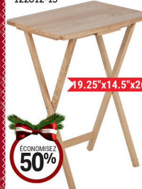
Table pliante en bois 122812-13