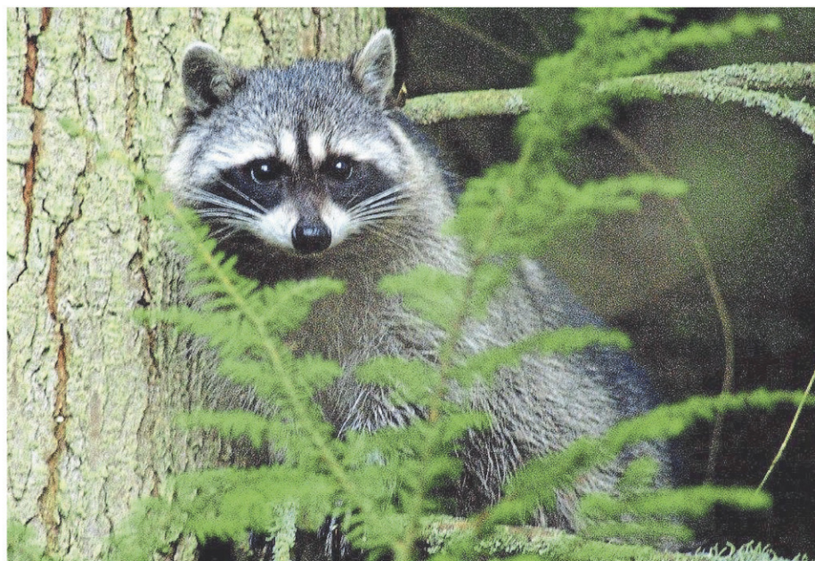
Le Plan de lutte contre la rage du raton laveur, en vigueur depuis 2006, a été élaboré en réponse à la détection du premier cas de rage du raton laveur au Québec.

rage du raton laveur au Québec. Deux autres opérations de vaccination se sont déroulées du 22 au 30 avril 2024 et du 7 au 24 août 2024 dans les mêmes localités.