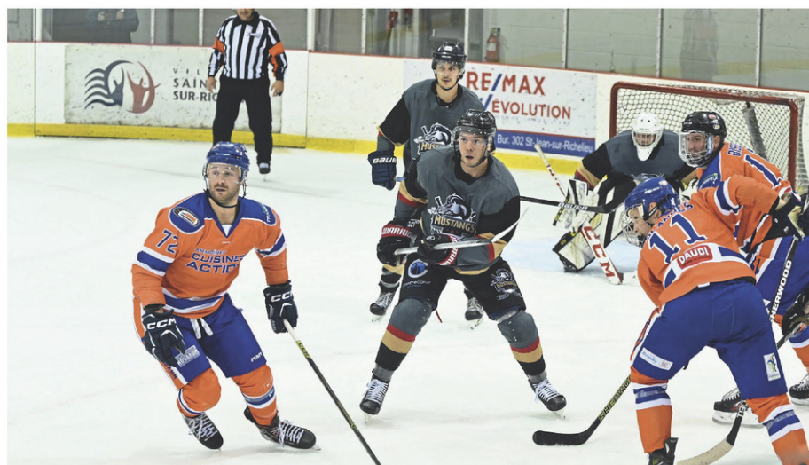
Les Mustangs et le Cuisines Action croiseront de nouveau le fer, samedi prochain, à l'aréna Madeleine-Auclair.