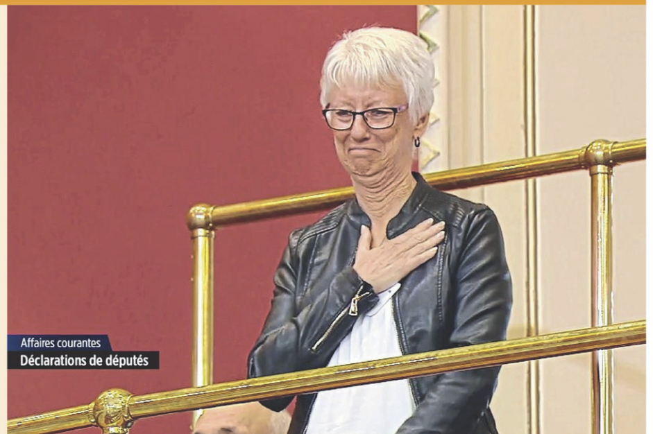
Affaires courantes Déclarations de députés