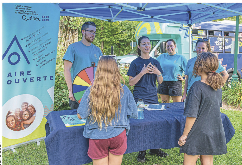
L'approche utilisée par Aire Ouverte permet d'établir un lien de confiance afin de mieux intervenir auprès des jeunes et de les accompagner adéquatement vers d'autres ressources.

L'équipe d'Aire Ouverte fait des interventions dans les écoles, centres de jeunes et autres lieux fréquentés par les jeunes. Elle réalise des activités dans les parcs l'été afin de socialiser avec les jeunes. L'unité mobile est également présente sur les lieux afin de réduire les situations d'exclusion ou d'isolement que les jeunes peuvent vivre.