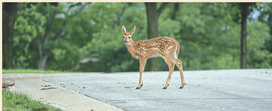
Les automobilistes doivent être vigilants, surtout à l'aube et au crépuscule, où le danger de heurter un animal est plus grand.

Enfin, actionnez vos freins à plusieurs reprises afin de signaler la présence de cervidés aux automobilistes qui vous suivent et ne jamais effectuer de manœuvre brusque. Lorsque la collision semble imminente, mieux vaut ralentir et freiner progressivement, précise le MTMD. (M.A.C.)