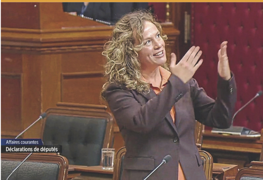
Affaires courantes Déclarations de députés