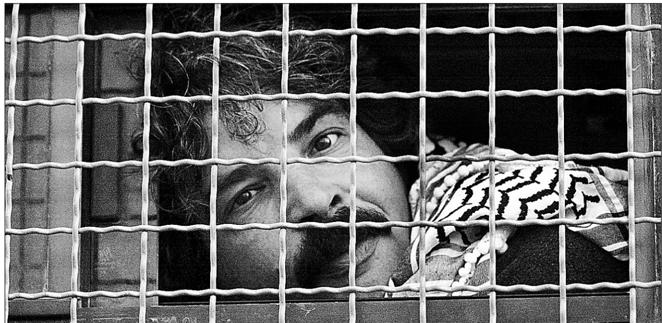
Dans un geste de bonne volonté envers la Jordanie, Israël a libéré neuf détenus jordaniens hier, à l'occasion de l'Aïd el-Fitr, la fête marquant la fin du jeûne du ramadan. Ici, l'un des détenus libérés est photographié à travers la grille d'un fourgon.

Ce plan, très critiqué par Sharon lui-même ainsi que par les colons juifs et les islamistes palestiniens, a été bien reçu par Yasser Arafat et les Européens, et n'a pas été critiqué par les États-Unis. L'ancien président américain Jimmy Carter, médiateur de l'accord de Camp David de 1978