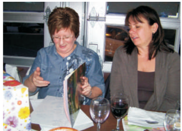
Un beau souvenir : un petit mot des collègues.