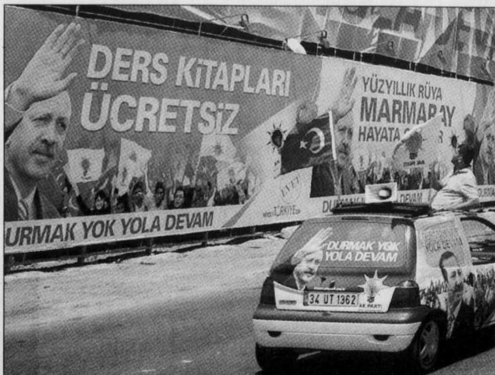
La publicité électorale de Tayyip Erdogan est omniprésente à Istanbul.

« C'est un parti qui a profondément changé même si ses principaux dirigeants, dont Erdogan,