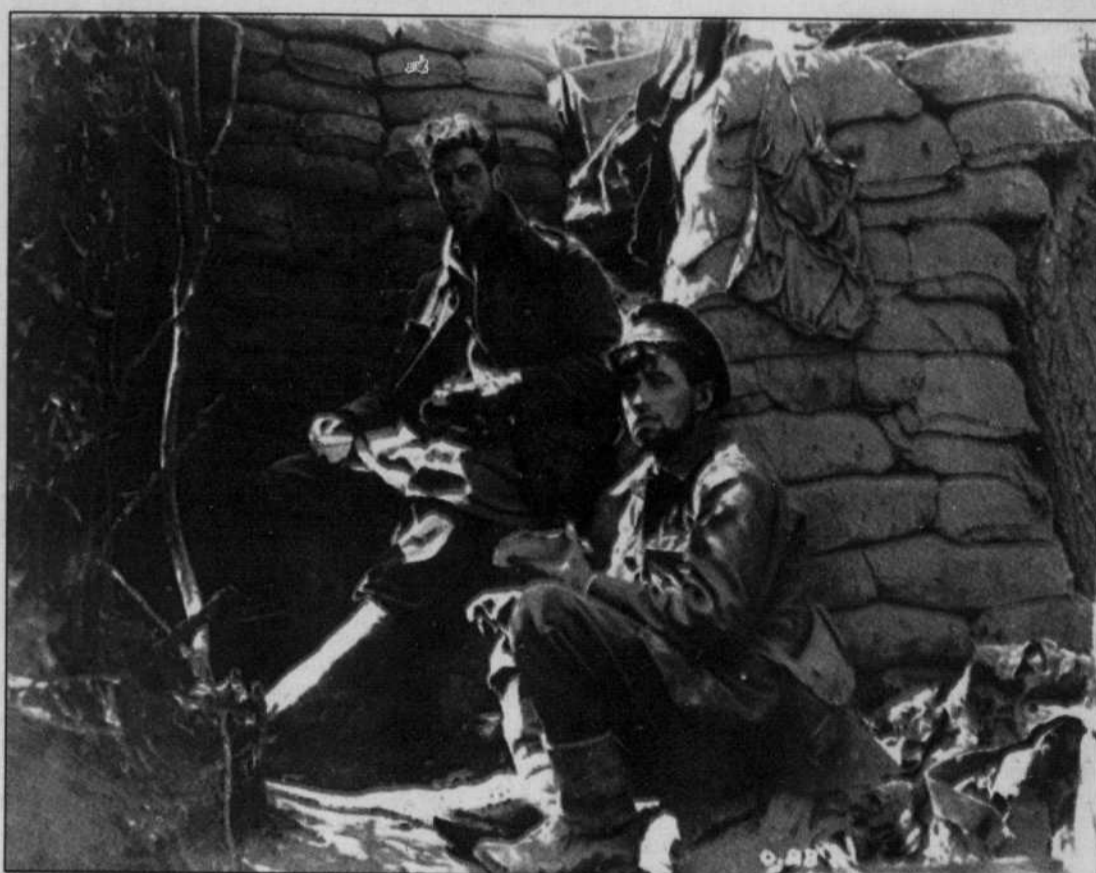
Dans les tranchées en France durant la Première Guerre mondiale. La photo a été prise entre 1915 et 1917.