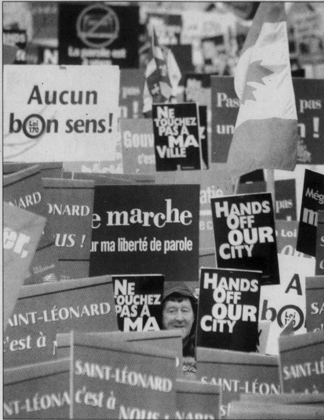
Manifestation contre les fusions de municipalités sur l'île de Montréal, en 2000. La communauté anglophone était particulièrement contre ces fusions. Sur le plan constitutionnel, les anglophones du Québec, qui sont très majoritairement fédéralistes, vont probablement considérer toute réouverture du débat politique sur le thème de la constitution «avec trépidation eu égard aux discussions constitutionnelles infructueuses des années 1990».

Les controverses relatives aux tentatives de reconnaître le Québec comme une «société distincte» ont contribué au naufrage des accords constitutionnels durant les années 1990. Pourquoi? Parce que le gouvernement fédéral et certaines autres provinces se sont enlisés en tentant d'enchaîner non seulement le «caractère distinct» du Québec, mais également en