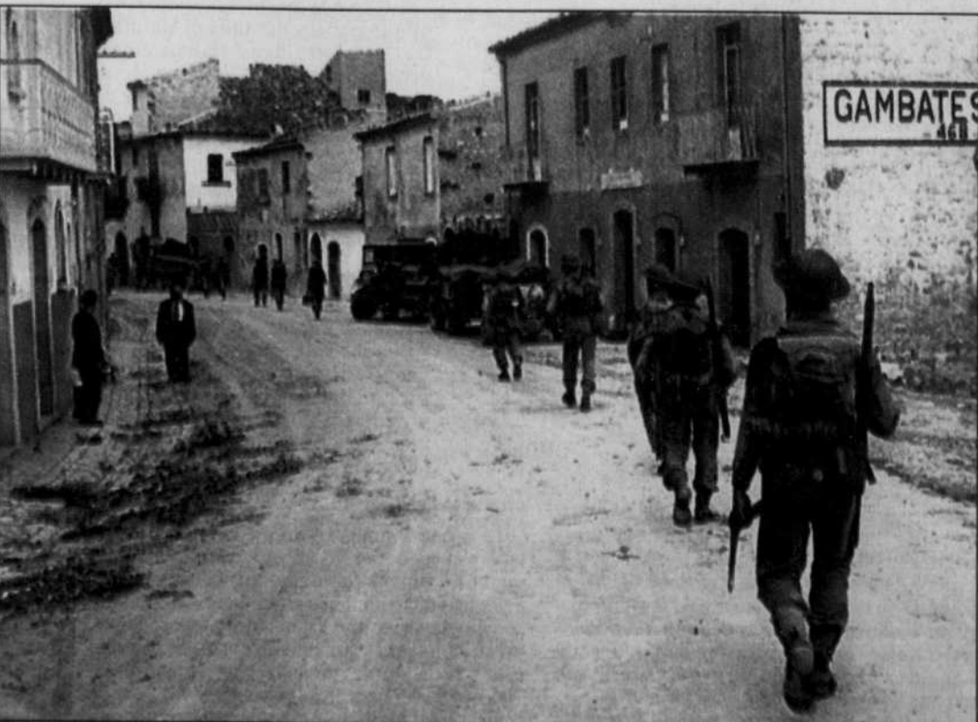
En octobre 1943, le 22 e Régiment faisait son entrée dans la ville italienne de Gambatesa.