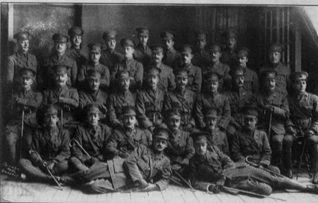
Les premiers officiers du 22 e Bataillon à Amherst, en Nouvelle-Écosse, en 1915.