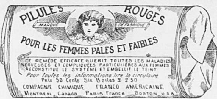
Fac-similé exact d'une boîte de Pilules Rouges.

Nos Pilules Rouges ont une spécialité pour les maladies des femmes seulement; c'est ce qui fait leur force et leur popularité. Il est impossible à un remède de guérir tous les maux. Jamais, dans l'histoire de la médecine, un remède n'a obtenu autant de guérisons que nos Pilules Rouges. Nous demandons à nos nombreuses clientes de ne pas comparer nos Pilules Rouges aux autres remèdes guérissant tous les maux, entre autres, aux remèdes liquides qui ne doivent leur effet stimulant qu'à l'alcool qu'ils renferment.