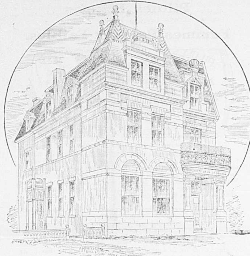
EDIFICE DE LA BANQUE DES MARCHANDS A SAINT-JEROME