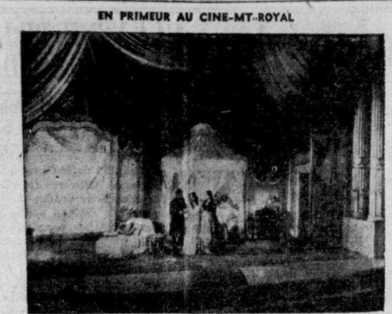
"La Traviata", film-opéra avec les étoiles de l'Opéra Royal de Rome, qui est actuellement à l'affiche du Ciné-Mt-Royal.

Paris, 6. (Canada-Mondial). — Des mesures énergiques ont été prises par la police économique pour prévenir le trafic sur les billets de 5,000 francs, récemment démonétisés. De nombreuses arrestations ont été opérées.