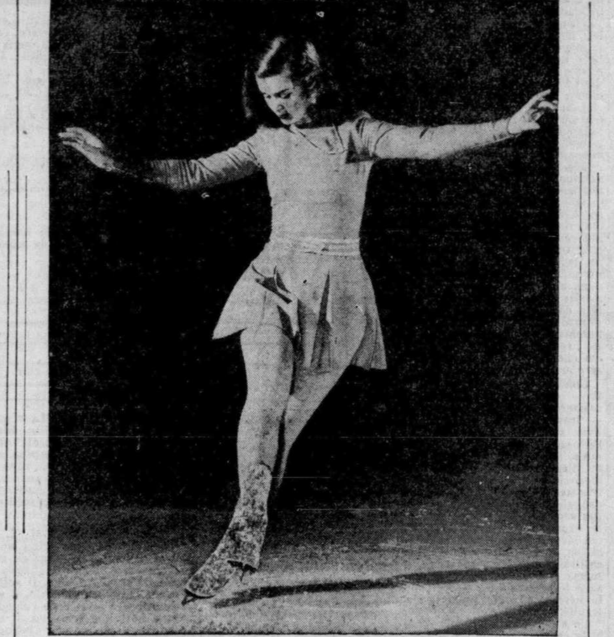
Reine de la mode, reine de la caméra, reine de l'athlétisme féminin pour la deuxième fois en trois ans, mais par-dessus tout, reine du patin, Barbara Ann Scott, charmante et fraîche dans toute sa jeunesse nous apparaît ici dans un cadre bien familier. La jolie patineuse d'Ottawa vient de réaliser son rêve: remporter le championnat du patinage de fantasia, aux Olympiades.

Cette victoire a brisé le monopole européen des championnats du patinage de fantasia. Il y a