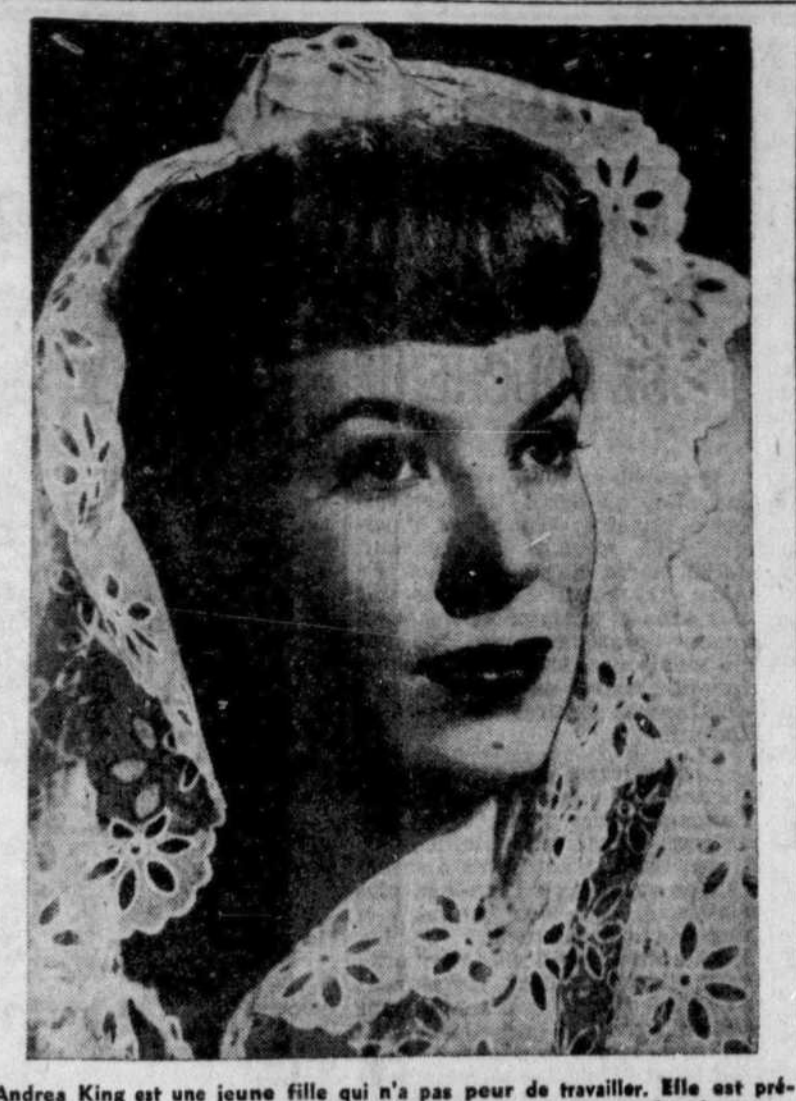
Andrea King est une jeune fille qui n'a pas peur de travailler. Elle est présentement la vedette de deux films que Hollywood tourne simultanément en des studios qui sont situés à huit milles de distance l'un de l'autre. La jolie Andrea semble se tirer assez bien d'affaire, depuis qu'elle est devenue "free lance".

Parlant de la Malaisie, il a exposé combien il était difficile de travailler à l'unification de six millions d'âmes d'origine différente. En commentant la nouvelle organisation du pays sous l'égide de l'Angleterre, il a fait l'éloge de cette initiative. La première de ce genre dans l'histoire de la Malaisie.