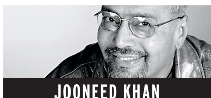
JOONFED KHAN ANALYSE

« Une catastrophe humanitaire jamais vue dans l'histoire du monde » se déroule dans l'est du Congo-Kinshasa, ravagé et pillé par ses voisins, a dénoncé un membre de l'archevêché de Bukavu devant une commission du Congrès américain cette semaine.