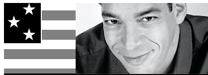
RICHARD HÉTU collaboration spéciale LA PRESSE À NEW YORK

« Les États-Unis font face en l'an 2001 à la plus sérieuse pénurie d'énergie depuis les embargos pétroliers des années 1970. » Du moins, c'est ce que prétend l'administration Bush II dans un rapport servant à justifier un plan massif et très controversé de relance énergétique.