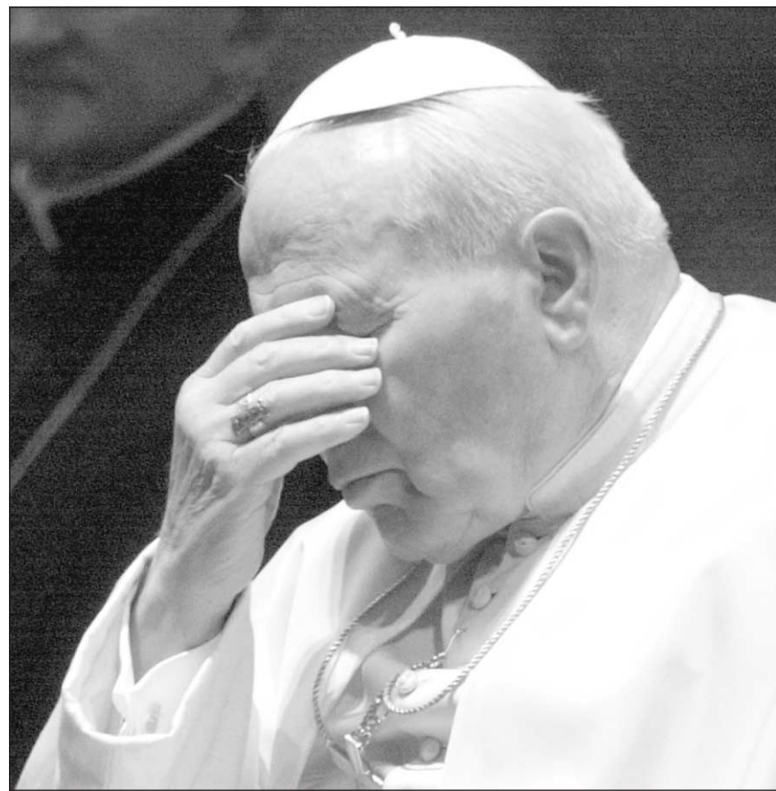
Le pape Jean-Paul II lors d'une petite pause, le 24 juin dernier, après son discours hebdomadaire au Vatican.

Le cardinal Koenig a critiqué le fait qu'encore aujourd'hui, « un monseigneur, dans n'importe quelle partie du monde, est nommé par le pape. » Selon lui, « l'Église universelle a besoin d'unité, mais aussi de diversité. »