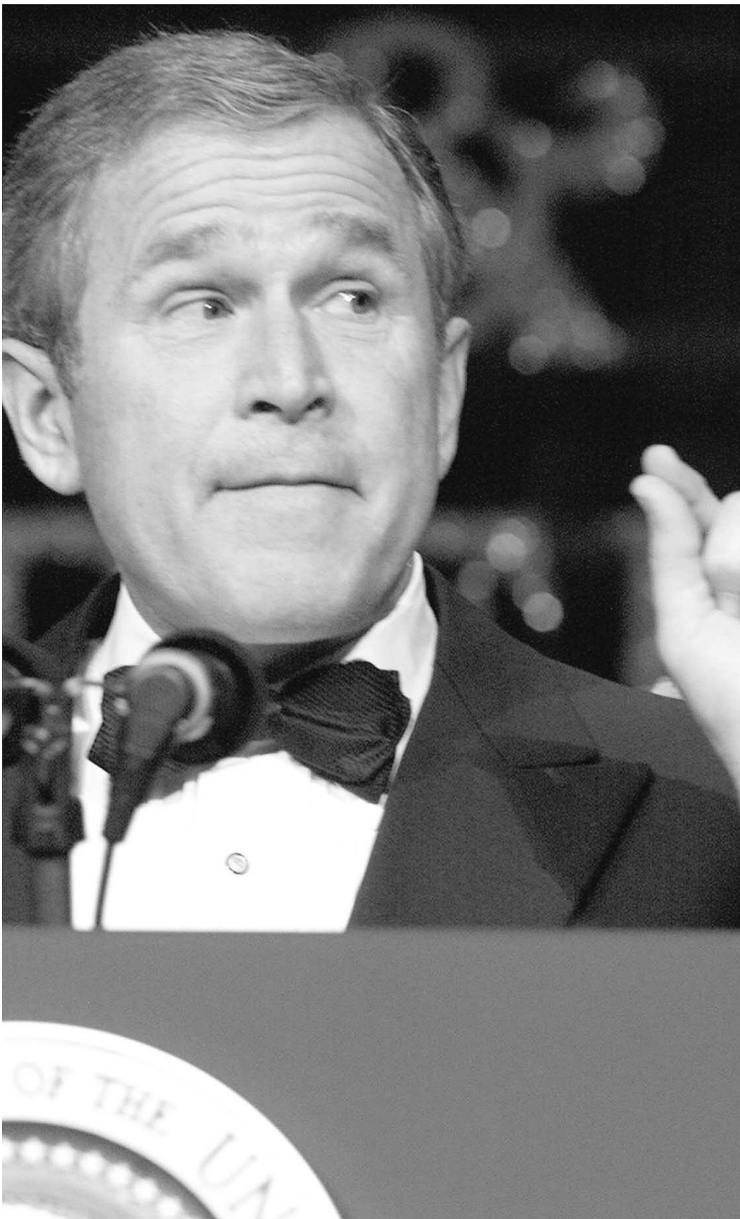
Le président Bush a rendu public jeudi un rapport de 163 pages préparé par le groupe de travail sur l'énergie de la Maison-Blanche dirigé par le vice-président Dick Cheney.

« Économiser l'énergie est peut-être un signe de vertu personnelle, mais ce n'est pas une base suffisante pour une politique de