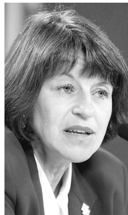
Dyane Adam, commissaire aux langues officielles, que le premier ministre Bernard Landry a invité à aller jouer... hors Québec.