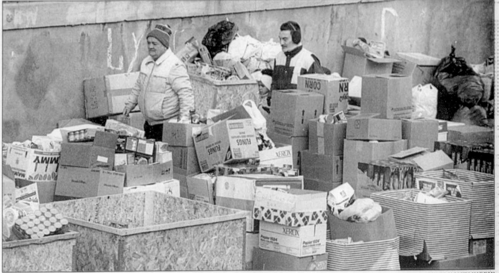
Jeunesse au soleil. Nées de la volonté et de la ténacité de certains groupes communautaires, les leurs d'espoir que l'on entrevoit chez nous reposent sur des formules originales qui obtiennent l'approbation de la plupart des défenseurs du respect de la personne humaine.

pouvoirs et de responsabilités vers les instances politiques locales et régionales ne pourra que favoriser le développement de ce genre d'expérience. En dépit de l'importance des pouvoirs détenus par les gouvernements centraux, on n'a jamais réussi à y centraliser toute l'imagination disponible au Québec. Il se trouve mille fois plus de suggestions, s'agissant de réinsertion professionnelle, dans les quartiers populaires de Montréal ou dans des villes de province comme Mont-Laurier, Montmagny, Plessisville ou Chandler, que dans les officines gouvernementales où la hiérarchie a (parfois) la manie d'aseptiser tout ce qui n'est pas politically correct . C'est donc vers les instances locales et régionales qu'il faut se tourner pour favoriser cette réinsertion. En fait, leur fait présentement défaut. Ces instances, municipalités et MRC, en collaboration avec les groupes communautaires, CLSC, commissions scolaires, corporations de développement économique et communautaire, etc. connaissent bien leur milieu et peuvent, mieux que quiconque, trouver la recette nécessaire à la réinsertion: identification des besoins à combler,