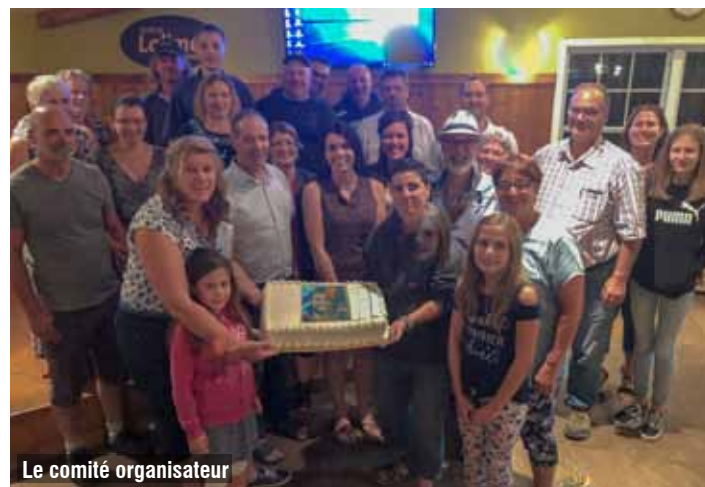
Le comité organisateur