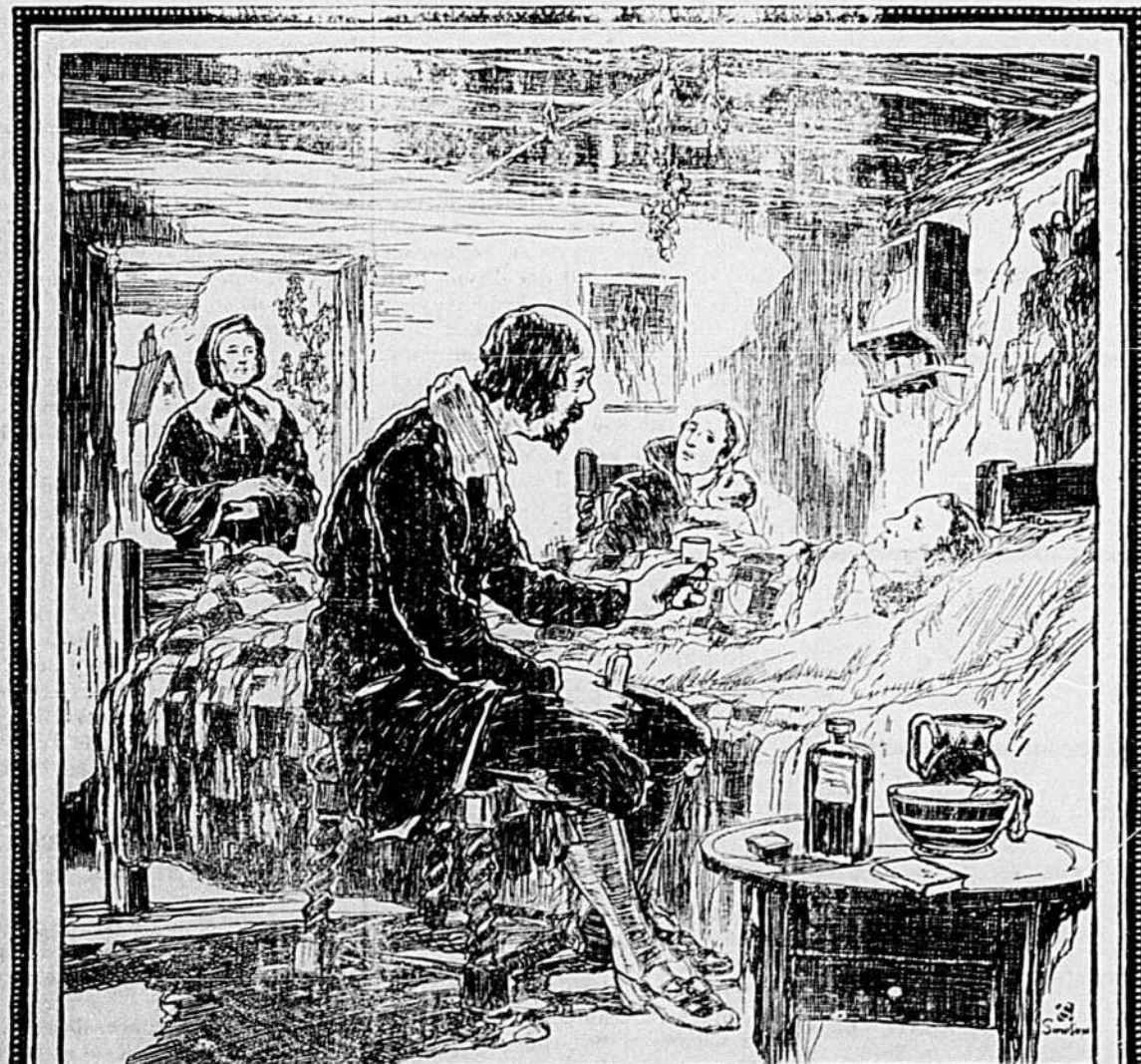
Chez Nous Sarrazin, un médecin d'autrefois

Parmi les hommes de bien de l'ancien régime, Michel Sarrazin, premier biologiste canadien et médecin-en-chef des hôpitaux de la Nouvelle-France, mérite une mention toute spéciale. Prodiguant ses soins à la population de la colonie tout entière et recevant pratiquement rien de ses patients, Sarrazin dépendait surtout, pour sa subsistance, d'une gratification du roi de France. A la suite d'une