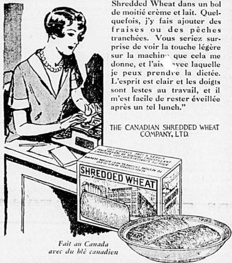
Fait au Canada avec du blé canadien

«Qu'est-ce que je prends pour un léger lunch en été? Je me fais servir deux biscuits de Shredded Wheat dans un bol de moitié crème et lait. Quelquefois, j'y fais ajouter des fraises ou des pêches tranchées. Vous seriez surpris de voir la touche légère sur la machine que cela me donne, et l'ais avec laquelle je peux prendre la dictée. L'esprit est clair et les doigts sont lestes au travail, et il m'est facile de rester éveillée après un tel lunch.»