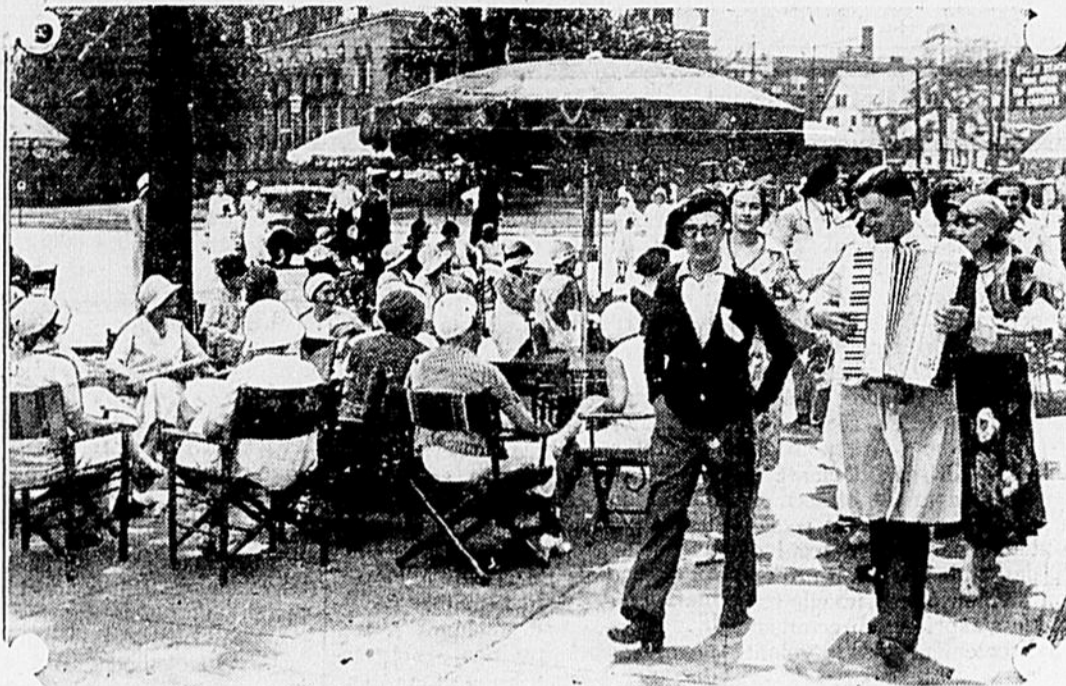
Dans les rues de Paris.