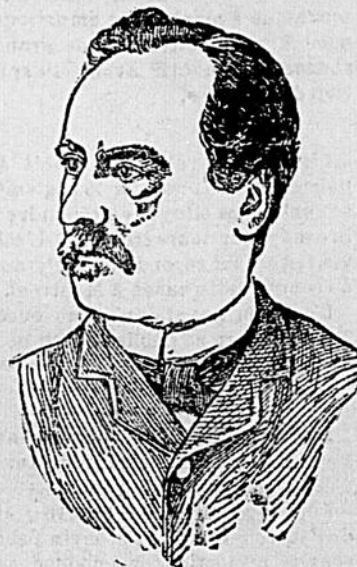
Par HECTOR BERTHELOT.

Prix net (au Bureau) 10 cts. " par la maille - 11 cts.