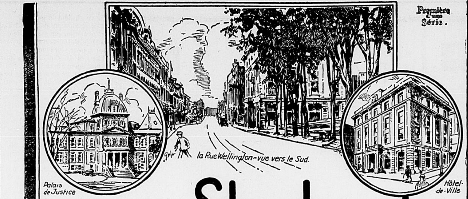
Palais de Justice

Ailleurs le Chemin de fer national du Canada expose, pour le bénéfice des européens peu au courant des méthodes de transport en Amérique, des sections de ses voitures