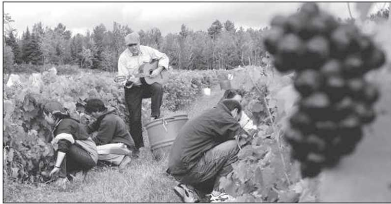
Au vignoble Le Cep d'Argent à Magog, la récolte du raisin se fait dans une ambiance résolument festive.

Ce vignoble magogois est d'ailleurs à l'origine de la Fête des