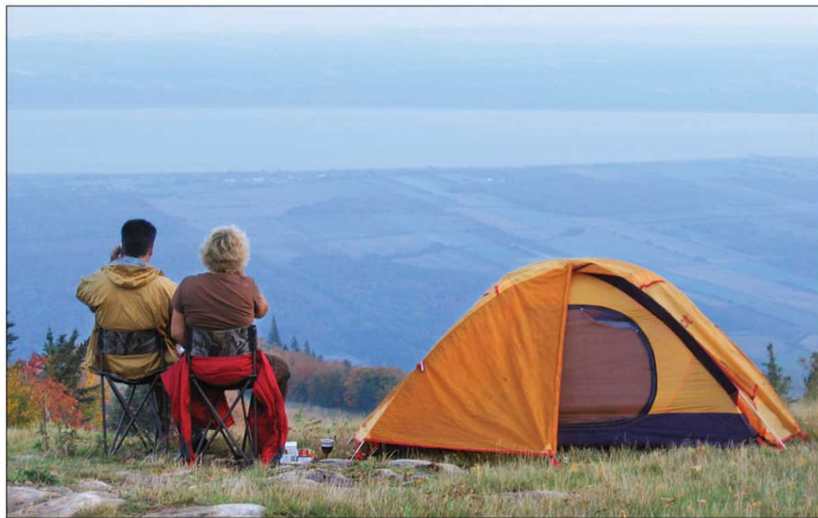
Il n'est pas nécessaire d'être un expert du camping ou un athlète accompli pour jouir de cette fenêtre de choix sur la nature.

Certes, l'animation bourdonnera, mais pour les visiteurs un peu plus contemplatifs, il sera toujours possible de trouver un coin paisible de nature pour admirer le paysage. Bottes de randonnée aux pieds, les marcheurs ont en effet plus de 32 kilomètres de sentier à se met-