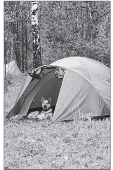
La tente, incontournable pour le confort de tous.

C'est le plus important. Dans plusieurs régions du Québec, l'eau des ruisseaux et contaminée par un parasite appelé Giardia Lamblia , qui peut causer des problèmes intestinaux. Il est donc essentiel de la traiter. On peut la faire bouillir quelques minutes, la filtrer avec un purificateur ou la traiter avec des solutions d'iode.