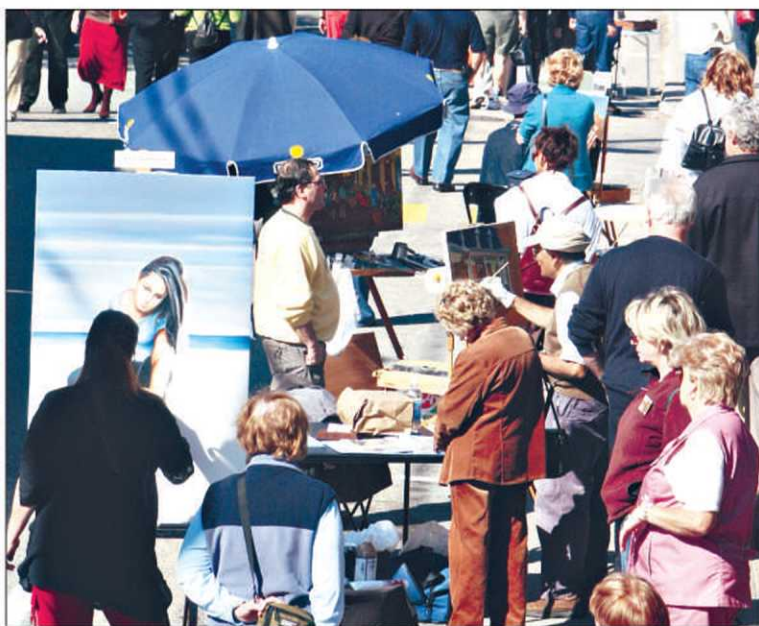
Chaque automne, des milliers de visiteurs profitent de Rêves d'automne.

Autre classique : Montagne en peinture. Le 27 septembre, la puis-