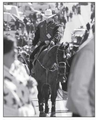
Les cavaliers sont les bienvenus dans les rues de Saint-Tite.