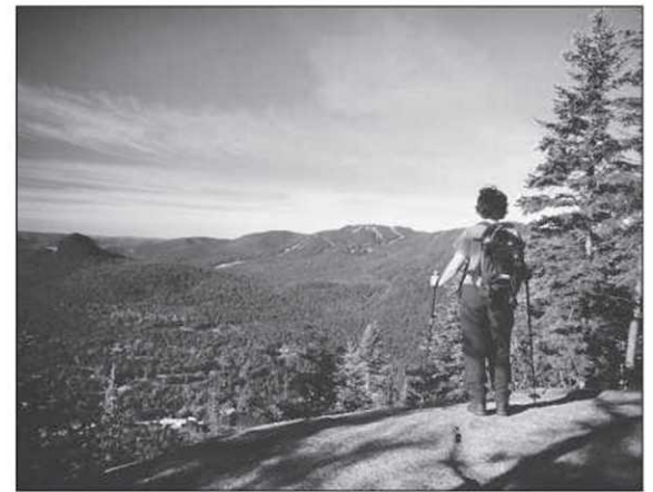
Le sentier du Centenaire est l'un des sentiers-vedettes du parc national du Mont-Tremblant.

Pour accéder au premier point de vue, il faut environ une heure de trekking. De là, on admire, en contrebas, les méandres de la rivière La Diable et au loin, le regard embrasse les «vieilles montagnes