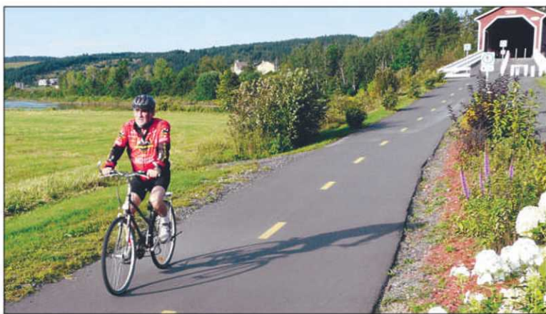
Une piste cyclable mène du plus long pont couvert du Québec — le second au Canada —, le pont Perreault, à Notre-Dame-des-Pins.

Visitez le www.destination-beauce pour plus de détails.