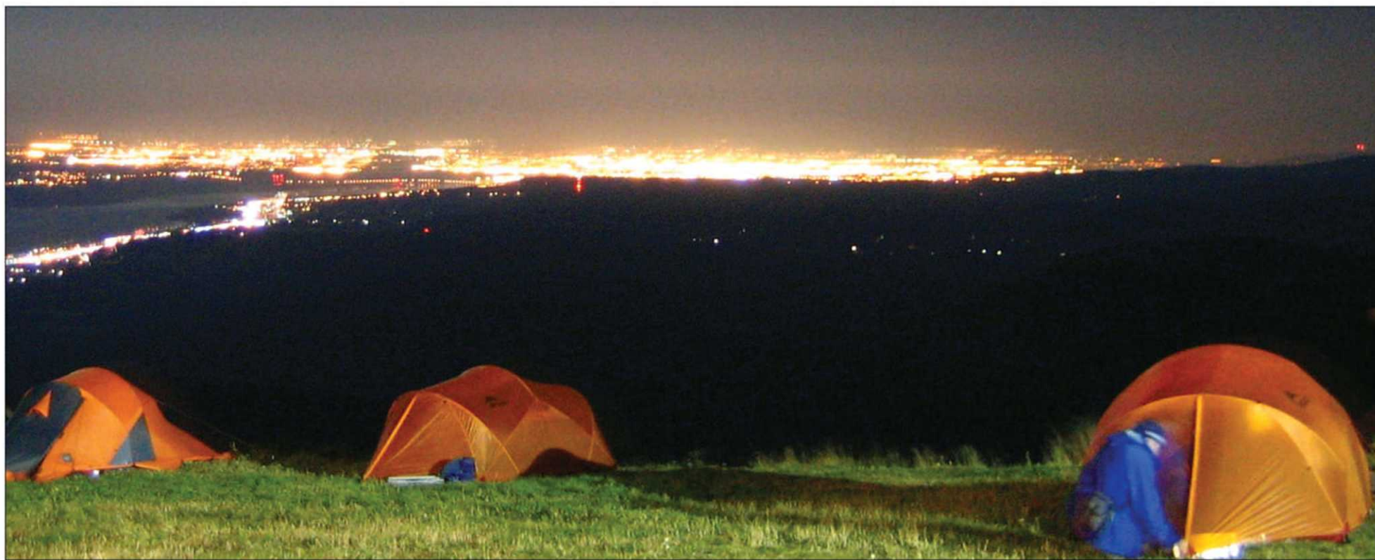
L'an dernier, environ 300 campeurs répartis dans plus de 125 tentes ont profité d'une unique autorisation annuelle à monter leur campement sur le toit du mont Sainte-Anne.