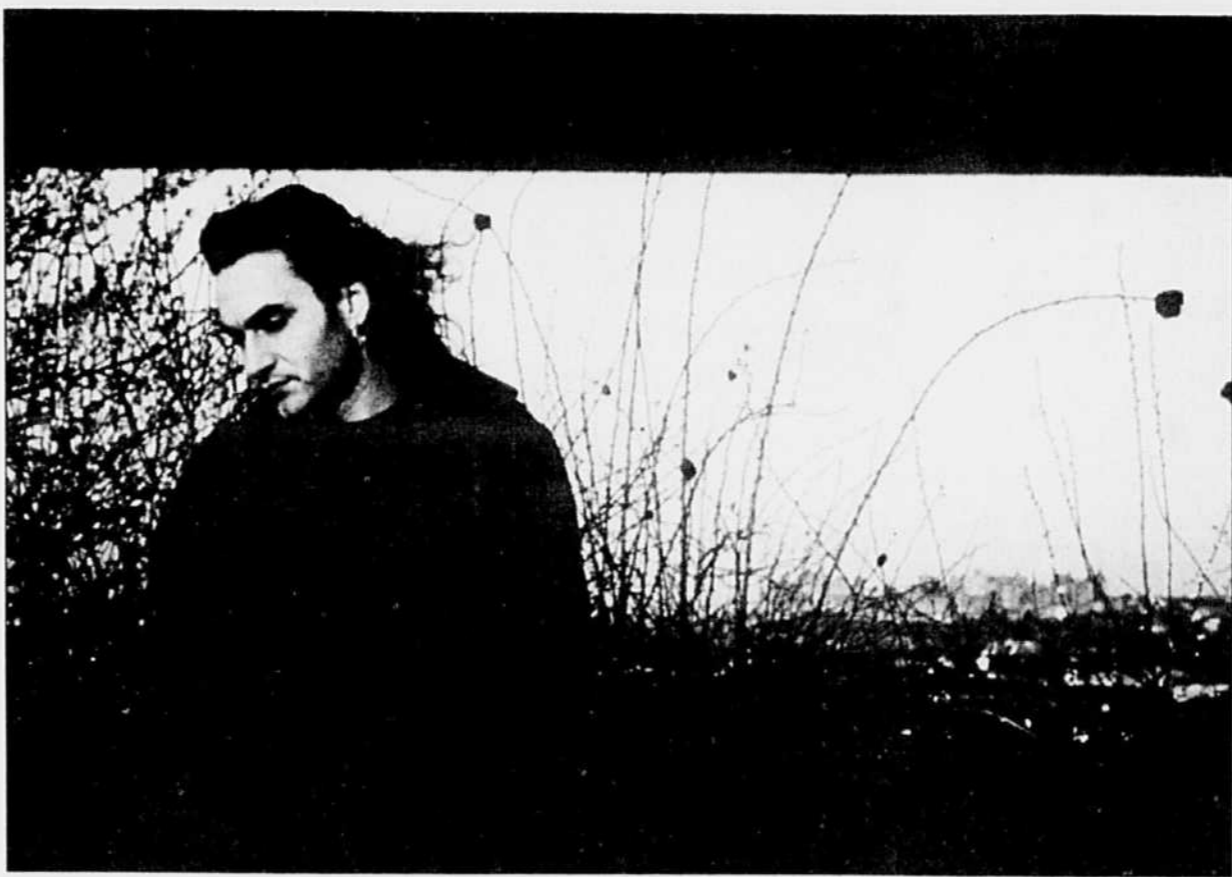
Un show même moyen de Stephan Eicher est encore l'un des plus formidables exemples de ce que le rock peut offrir.

Ce soir, à Montréal, Jonasz donnera, au théâtre Saint-Denis, un spectacle qui reprendra avec des musiciens spécialement choisis pour l'occasion — «J'ai toujours d'excellents musiciens», précise-t-il — l'essentiel du dernier album Où est la source (Warner, 1992) et les plus grands succès. Et probablement que nous finirons la soirée en lui rappelant: J'veux pas que tu t'en ailles . Mais pour tous ceux qui n'auraient la chance d'assister à l'événement, Warner vient de sortir un florilège enregistré en public lors de la tournée au Zénith en 1992. C'est mieux que rien!