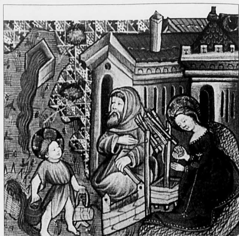
La Sainte Nativité de Notre-Dame, une toile datant du XVIe siècle et propriété de la Bibliothèque nationale à Paris. Ce tableau illustre la page couverture du livre Les enfances du Christ.