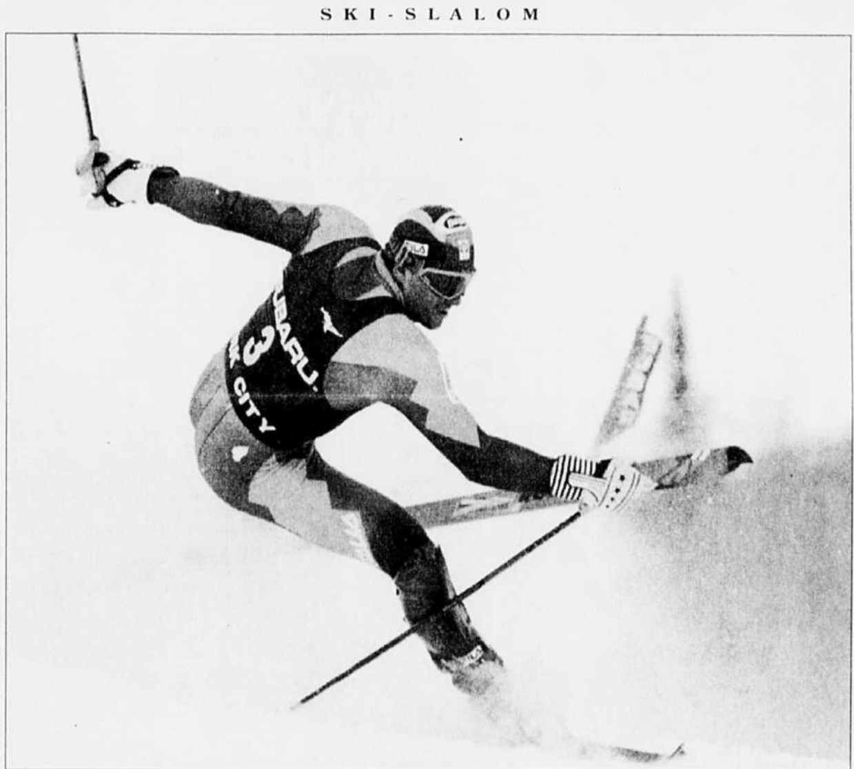
L'italien Alberto Tomba est sorti de la piste au cours de la première manche du Slalom de Park City hier.

Demain: d'autres clubs, d'autres activités, et les mots aussi, de quelques-uns pour qui la marche... c'est le pied.