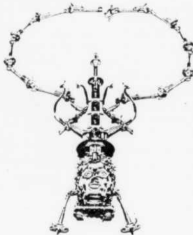
Grand Prix des métiers d'art Du 22 mars au 28 mai 1989

Les nombreuses transformations de la famille québécoise depuis la Révolution tranquille: impact du travail de la femme à l'extérieur de la maison, définitions nouvelles des rôles masculin et féminin, place de l'enfant dans la famille, nouveaux types de familles. Par des mises en situation bien choisies, des reproductions ingénieuses du décor familial et des jeux interactifs, l'exposition laisse place à l'information, mais aussi à la réflexion personnelle et à l'humour.