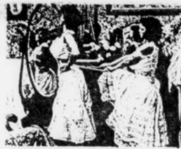
Souffrir pour être belle Jusqu'au 4 septembre 1989

Hydro-Québec a contribué, par son support technique et financier, à la réalisation de cette exposition.