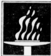
Les Jeux graphiques MCMLXXXVIII Graphisme Québec Du 7 mars au 16 avril 1989

Lettres d'amour venues des quatre coins de la province, datant du XVIII e siècle jusqu'à aujourd'hui; correspondance de Simone Monet-Chartrand, du poète Alain Grandbois et de bien d'autres noms connus; la dernière missive de Chevalier De Lorimier, patriote de 1837, à son épouse; une collection de cartes de souhaits du début des XIX e et XX e siècles. Cher Amour , un rendez-vous à ne pas manquer!