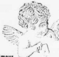
Cher Amour Jusqu'au 12 mars 1989

Lettres d'amour venues des quatre coins de la province, datant du XVIII e siècle jusqu'à aujourd'hui; correspondance de Simone Monet-Chartrand, du poète Alain Grandbois et de bien d'autres noms connus; la dernière missive de Chevalier De Lorimier, patriote de 1837, à son épouse; une collection de cartes de souhaits du début des XIX e et XX e siècles. Cher Amour , un rendez-vous à ne pas manquer!