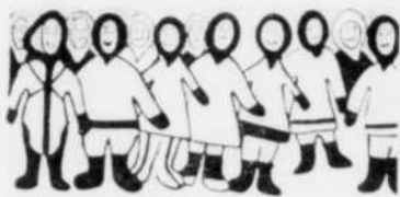
Toundra, Taïga Les Inuit du Nouveau-Québec Les peuples du Nord sibérien Jusqu'au 26 mars 1989

Deux expositions en une, ou une exposition en deux... Quelques aspects de la vie des peuples du Nouveau-Québec et du Nord de la Sibérie. D'une part, la vie quotidienne des Inuit d'aujourd'hui, une réalité qui nous oblige à revoir nos perceptions; d'autre part, une rencontre avec treize peuples de la Sibérie actuelle, si proches et parfois si différents.