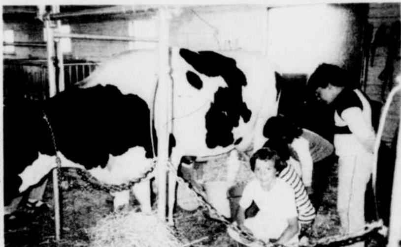
Les enfants sont toujours surpris de constater que le lait est chaud quand ils traient la vache. Traire une vache est toute une expérience pour eux.