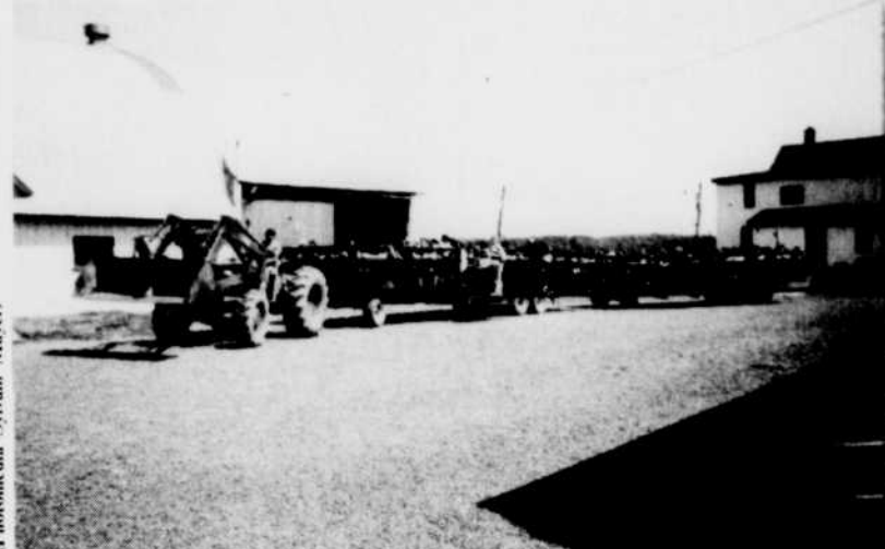
La promenade en chariot dans les bois est fort populaire comme on peut le constater sur la photo.