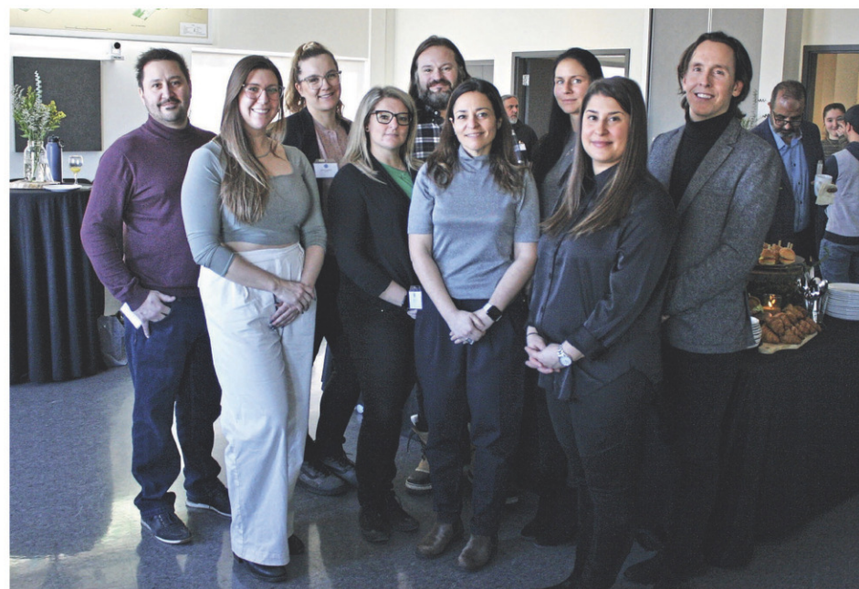
Quelques-uns des partenaires du projet de la nouvelle carte interactive de la campagne La Montérégie, le Garde-Manger du Québec , lors de son lancement, le 15 février.

Destiné aux consommateurs, au milieu des hôtels, des restaurants et des institutions, ainsi qu'aux transformateurs, ce répertoire permet de mettre en lumière la grande variété de produits alimentaires disponible en Montérégie et de promouvoir l'achat de proximité.