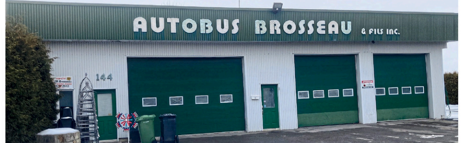
La friperie La Suite des Choses occupera tout l'espace situé derrière les deux portes de garage du côté droit du bâtiment

Des bénévoles s'affairent à aménager les