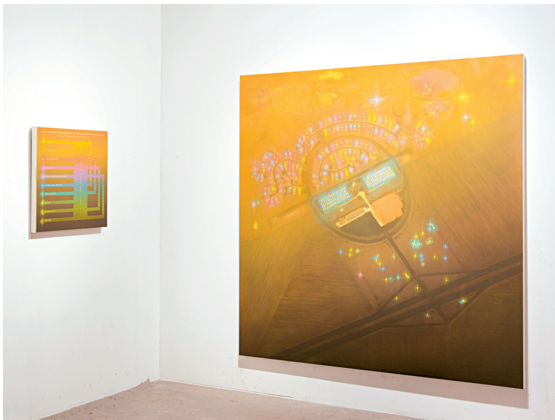
Nicolas Grenier, On apprécie la proximité des autres (diptyque), 2012, huile sur toile.

Les plus récentes œuvres de l'artiste, exposées chez Art Mûr, la galerie qui le re-