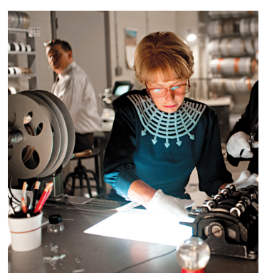
Helen Mirren incarne Alma, l'épouse d'Alfred Hitchcock.

Pour tout dire, cela faisait huit ans qu'Hopkins était pres-