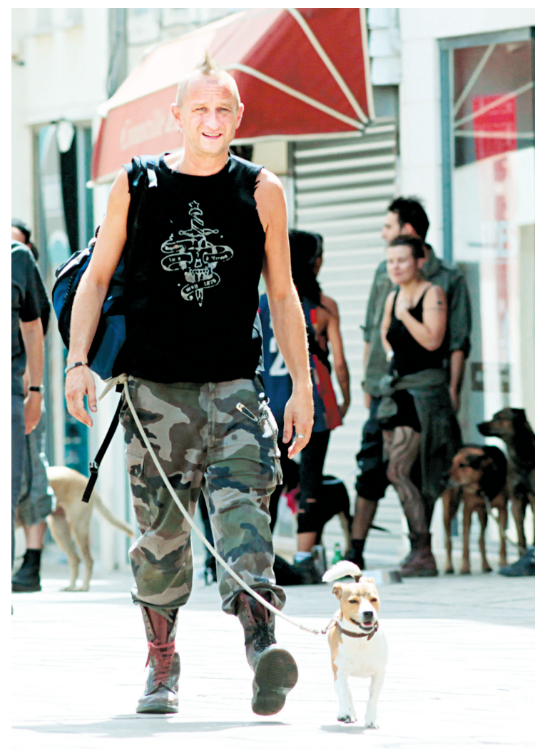
Le grand soir invite à la révolution