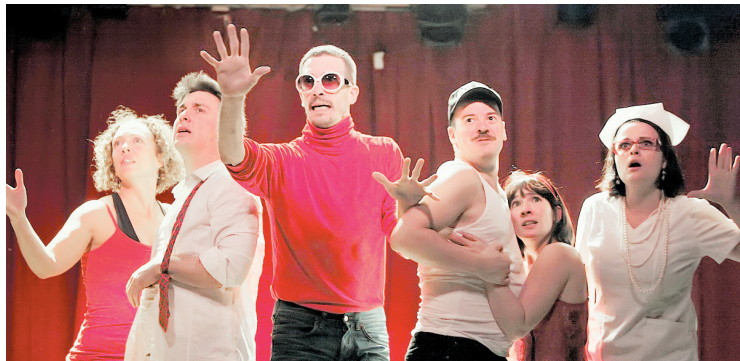
Ci-dessus, le spectacle musical Noël 1933 , au théâtre Exaltemp; et MTL_APK (Montréal Apokalypse) , présenté à la Sala Rossa.