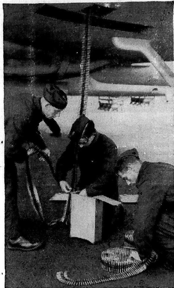
Les succès britanniques en Afrique orientale et dans la Méditerranée sont presque toujours dus à l'action simultanée et conjuguée des trois armes : marine, armée et aviation. L'on voit ici des soldats de la R. A. F. armant l'une des mitrailleuses d'un bombardier Blenheim avant des manoeuvres de coordination.

tir du 30 avril, à moins d'avoir obtenu au préalable une licence. Le nouveau décret interdit la fabrication de tous les types de glacières métalliques, électriques ou non, destinées à des usages domestiques. Il est entendu que l'on permettra aux fabricants de compléter les appareils dont au moins 80 pour cent des pièces sont déjà fabriquées.