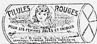
Le papier est blanc imprimé en encre rouge.

Les Pilules Rouges, pour les Femmes Pâles et Faibles, sont vendues en boîte seulement. Si votre marchand ne les a pas, envoyez-nous par la malle 50c en timbres pour une boîte, ou $2.50 par lettre enregistrée ou mandat-poste pour 6 boîtes.