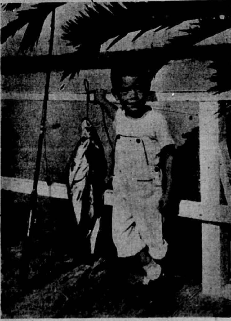
Pêcher dans les mers du Sud! N'y a-t-il pas là un élément magique qui nous fait rêver dès que l'on prononce ces mots? Et la pêche est bonne dans ces eaux méridionales, ainsi qu'on en peut juger à la belle capture réussie par le petit bonhomme que l'on voit ici, à la colonie de Sea Island, en Géorgie.

Le chef britannique de l'Opposition, M. Winston Churchill, a accordé l'appui de son parti conservateur au principe qu'un statut temporaire de Dominion pour l'Inde, peu importe que ce pays reste unifié ou se divise en États Hindoustan et Pakistan.