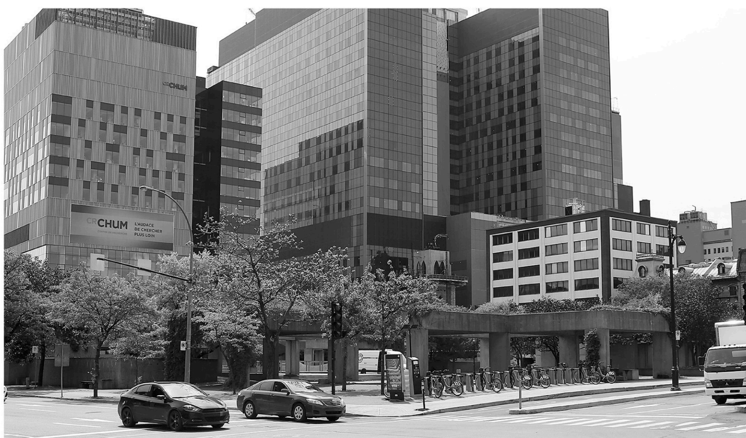
Les travaux de réaménagement du square Viger sont retardés en raison de l'incertitude quant à l'état réel de la structure recouvrant l'autoroute Ville-Marie.