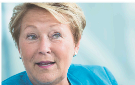
PEDRO RUIZ LE DEVOIR

Extraits de l'allocution que prononcera samedi Pauline Marois lors du colloque organisé par la Société Saint-Jean-Baptiste à l'occasion du 40 e anniversaire de l'accession au pouvoir du Parti québécois.