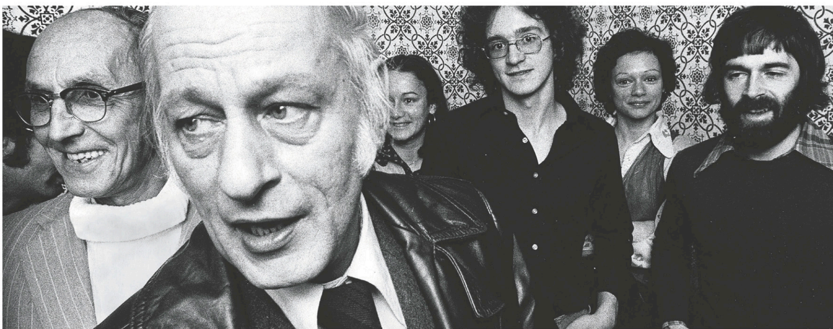
René Lévesque en compagnie de militants péquistes en 1976