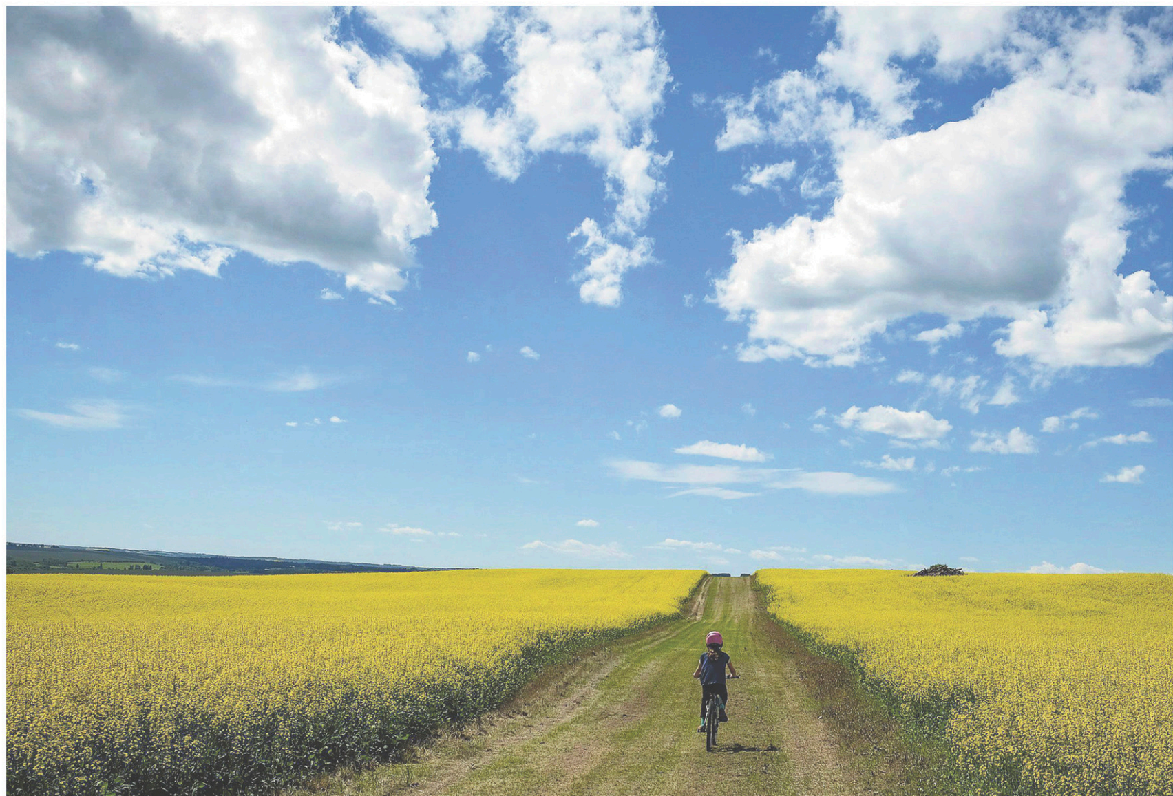
JEFF MCINTOSH LA PRESSE CANADIENNE

Pour éviter la création de ghettos, il ne suffira jamais de vouloir le bien.