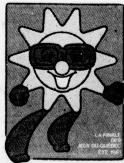
LA FINALE DES JEUX DU QUÉBEC ÉTÉ 1981

avec une armée de 1,500 personnes bénévoles qui sera gonflée à 3,000 au moment où seront engagés les trois blocs de compétitions. A la natation, le ski nautique, la crose, l'athlétisme, le plongeon, le canoë-kayak, la voile, le tennis, le tir à l'arc, le soccer, le golf, la pétanque, le cyclisme, le water-polo et la balle-molle, s'ajouteront deux disciplines de démonstration, la planche à voile et l'"inter-crosse". Cette dernière activité privilégie la crose de plastique, plus accessible aux enfants et pour la pratique intra-murale. Quinze emplacements sont identifiés pour les épreuves, répartis dans un rayon de douze milles, dont sept concentrés à Hull. La programmation de la 17e finale des Jeux du Québec prévoit plusieurs épreuves et événements au lac Leamy et à la marina du lac Deschênes, et c'est à Hull qu'auront lieu les cérémonies d'ouverture et de fermeture de la finale.