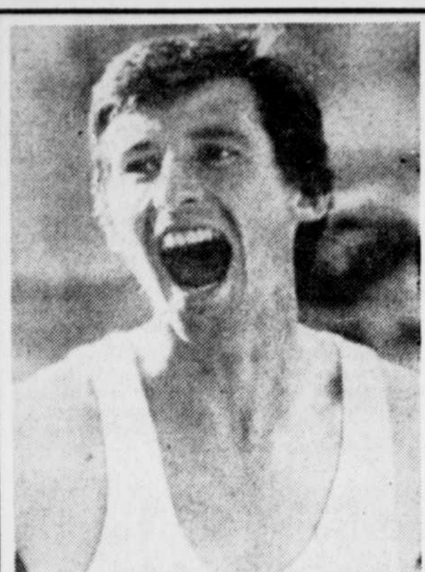
Sébastien Coe exulte de joie après qu'il eut fracassé le record mondial du 800 mètres.