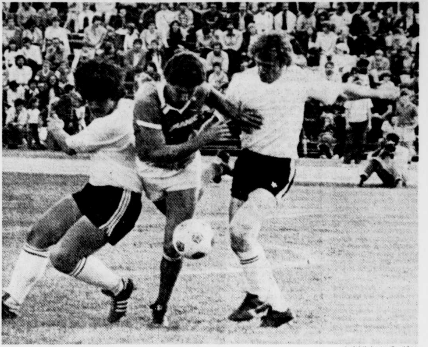
A deux sur un avant du Manic, rien de plus sûr pour limiter l'avance d'une offensive menée par l'équipe de soccer professionnel de la Ligue nord-américaine.