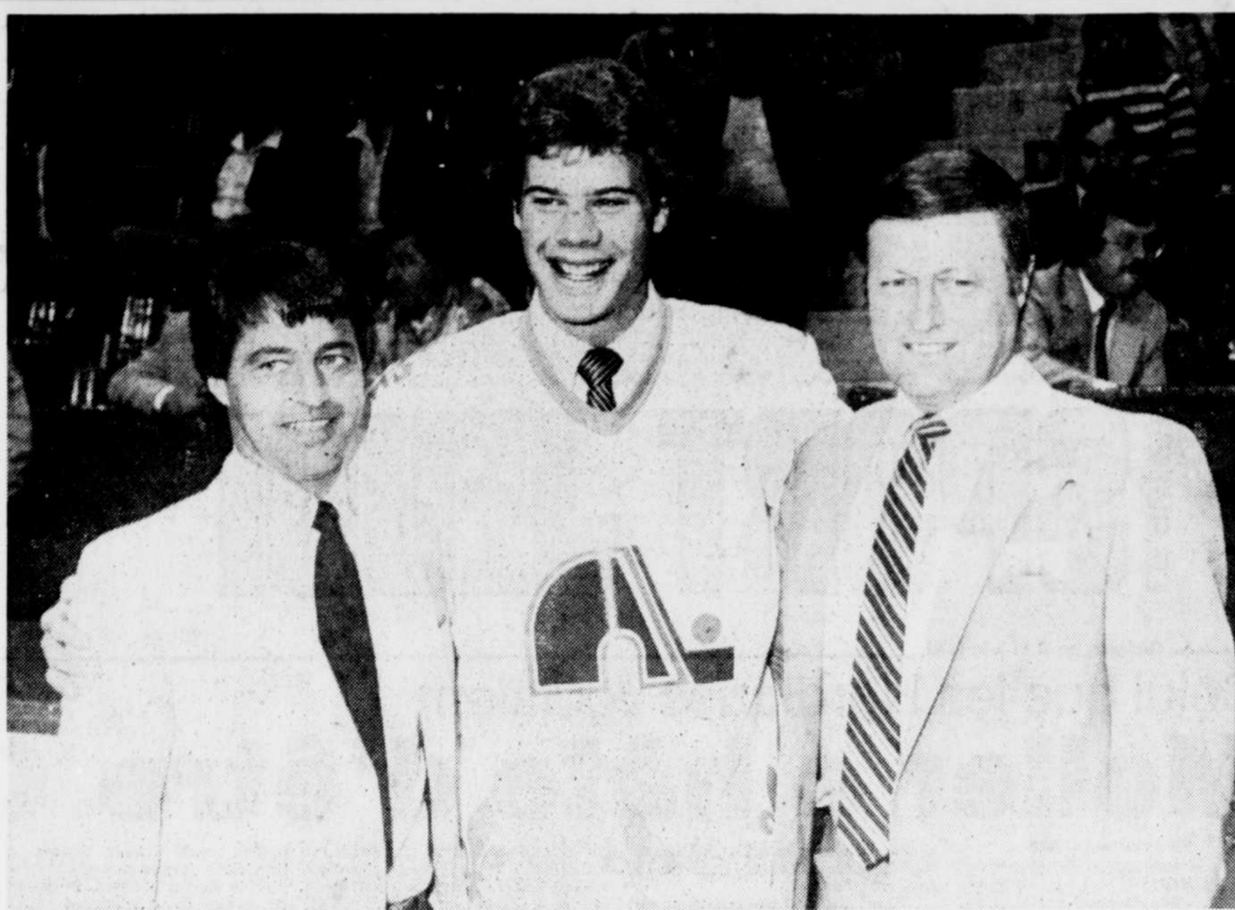
Les Nordiques de Québec ont pu sélectionner un joueur qui leur avait été recommandé à plusieurs reprises, en choisissant, hier, en première