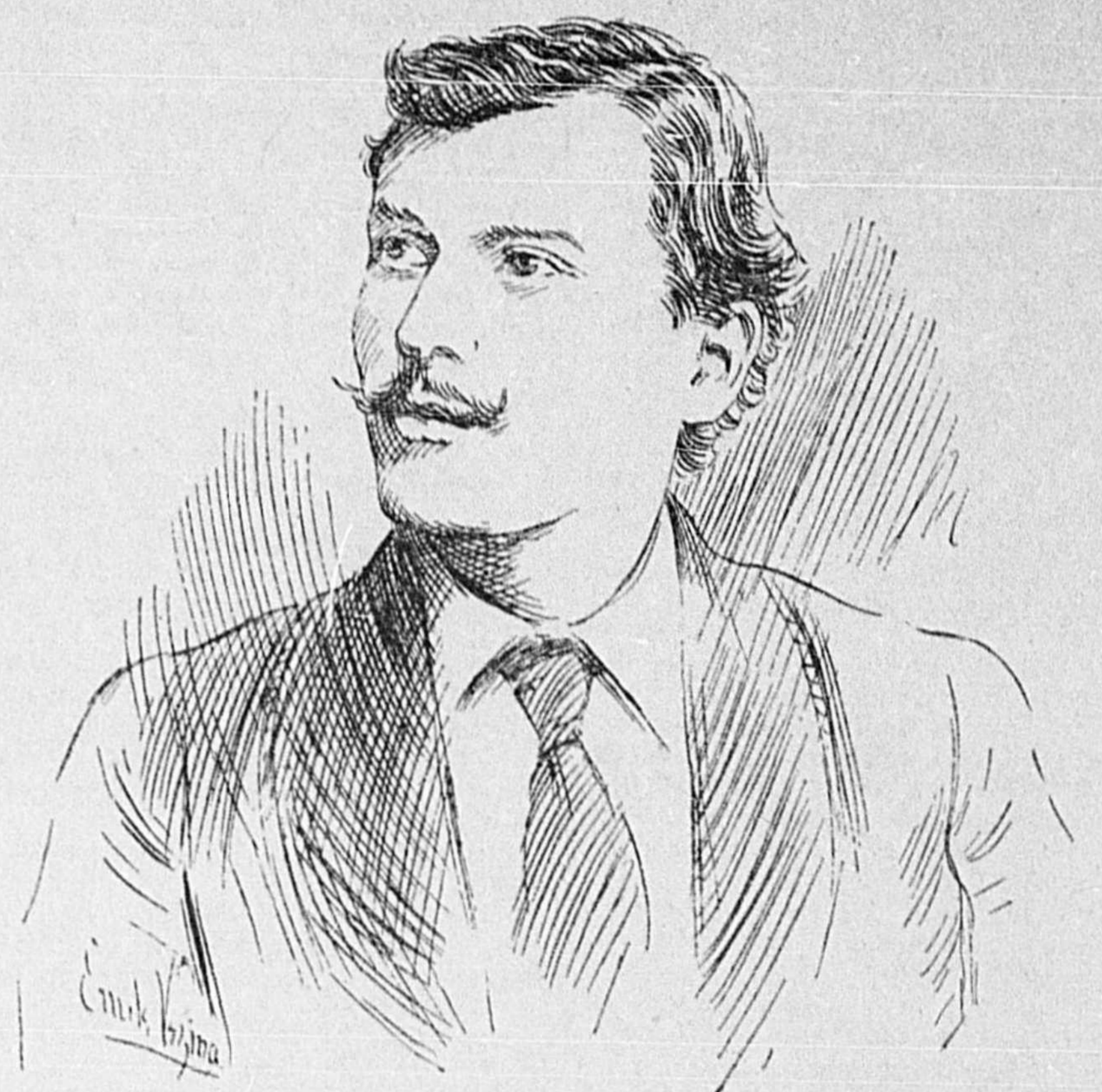
M. ALBERT LOZEAU