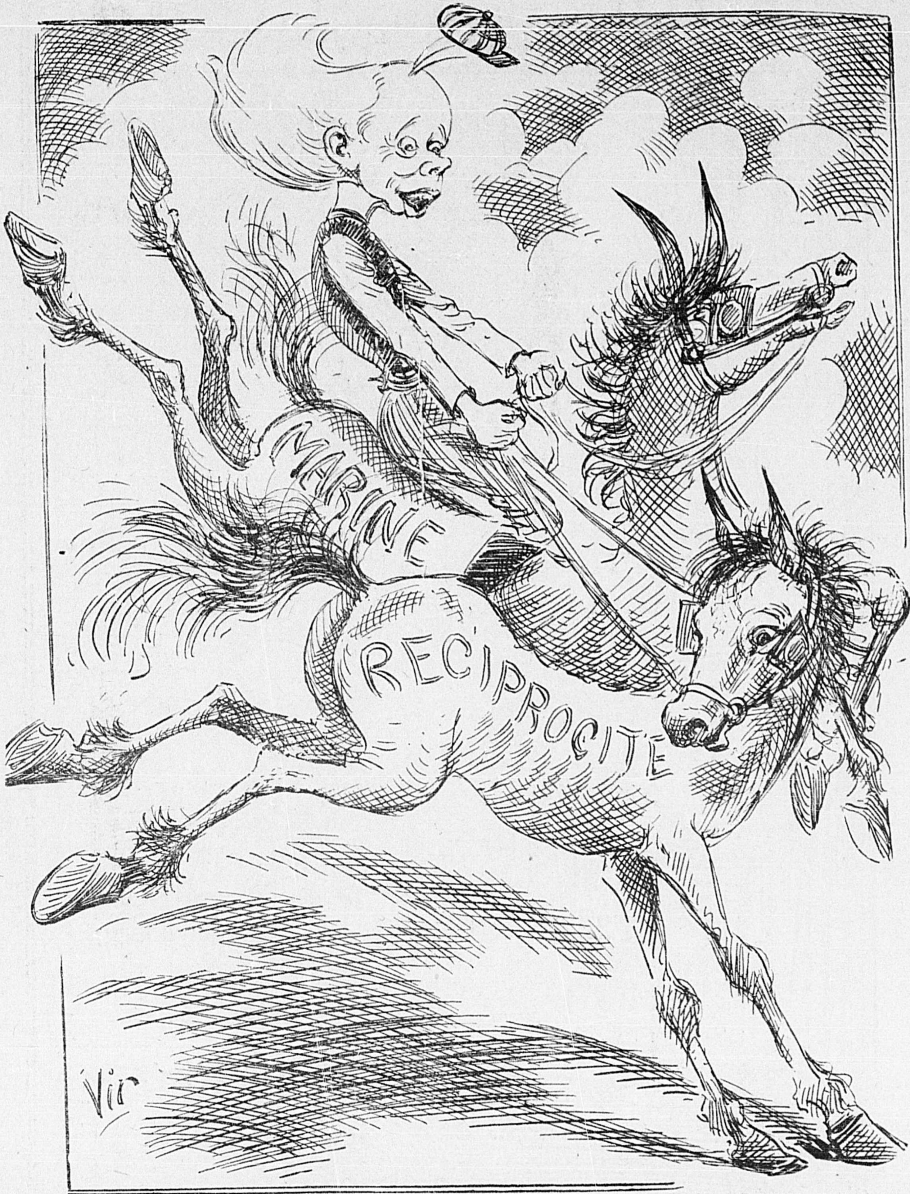
SIR WILFY: J'aurais peut-être pu mener un de ces chevaux-là mais les deux à la fois, ça serait mieux d'y renoncer!