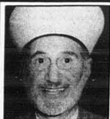
Cheikh Hassan Khaled

Dans son communiqué, le Conseil d'État, organe suprême du pays, n'a donné aucune précision sur la manière dont le coup de force avait été déjoué, ni sur les effectifs des putschistes.