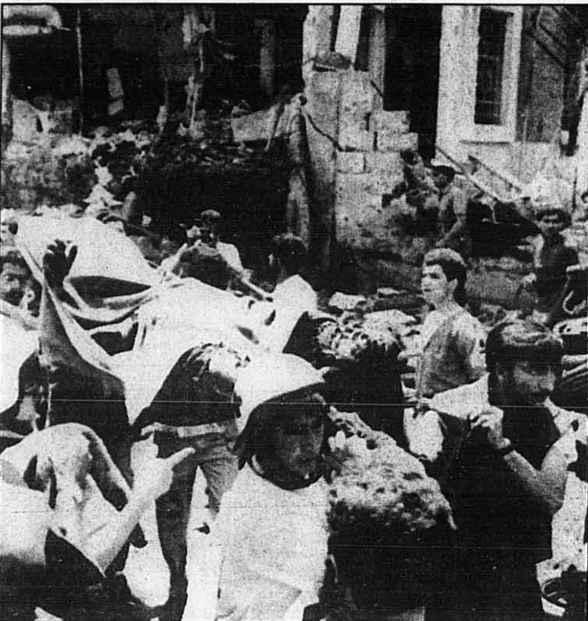
Le corps du mufti Hassan Khaled est enlevé sur un brancard, après l'attentat qui a tué 21 autres personnes, à Beyrouth-Ouest, hier.

En outre, le chef spirituel de la communauté chiite au Liban, l'imam Moussa Sadr, est porté disparu depuis le 30 août 1978, à l'issue d'un voyage en Libye.