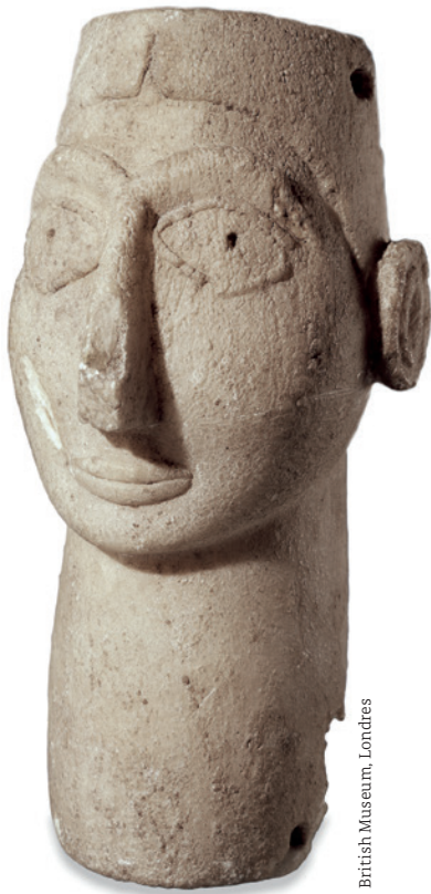
British Museum, Londres

L'exposition a accueilli 108 521 personnes, un succès rendu possible par les prêts du petit-fils de l'écrivaine, Mathew Prichard, d'un collectionneur privé, Michel Cozic, ainsi que des plus prestigieuses institutions comme le British Museum de Londres ou le Metropolitan Museum of Art de New York. Ont complété l'événement une série de conférences d'experts sur l'archéologie syrienne et irakienne offertes par le Musée et par les Belles soirées de l'Université de Montréal. Finalement, les visiteurs ont pu se procurer Sur les traces d'Agatha Christie , une publication souvenir de l'exposition montréalaise dédiée à la Reine du crime, Agatha Christie.