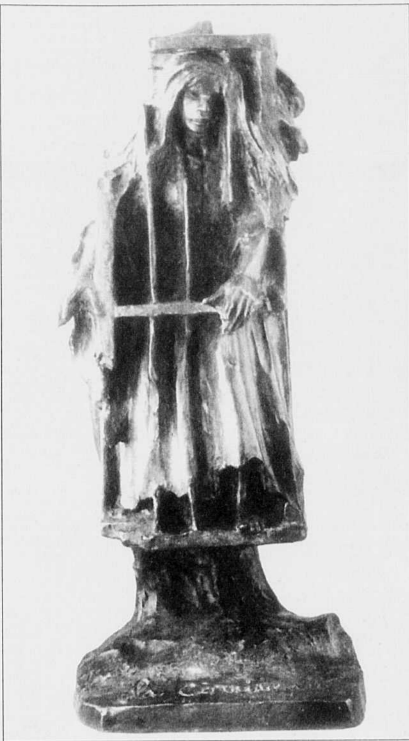
Les fantômes, gnomes et sorcières hantent depuis longtemps nos paysages littéraires. La Corriveau , coulée ici dans le bronze par Laliberté, est l'un des personnages les plus ambigus de toute la littérature québécoise.

Louis Fréchette est né en 1839 à Saint-Joseph-de-la-Pointe-Lévy. Cet homme aux multiples talents, dont la figure a marqué la fin du XIX e siècle québécois, aura été tour à tour avocat, traducteur à l'Assemblée législative et fondateur du Journal de Lévis , dont l'orientation libérale l'oblige à quitter le Québec pour les États-Unis, où il devient rédacteur pour L'Amérique . En 1871, il rentre au pays, et se lance en politique, pour finalement reprendre l'exercice du droit en 1882. Il cessera toute activité en 1907 et s'éteindra l'année suivante. L'œuvre qu'il nous a laissée est celle d'un poète ( La Voix d'un exilé , Fleurs boréales , Les Oiseaux de neige ), d'un conteur ( La Noël au Canada , Contes d'autrefois ), d'un dramaturge ( Félix Poutre ) et d'un journaliste.