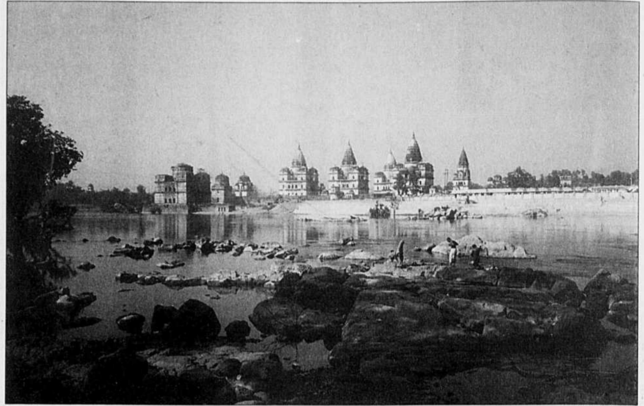
Le traditionnel bain sur les rives du Gange.

L'aventure de ce prince est une transposition, au plan mondain, de ce que d'autres héros accomplissent dans la grande littérature ancienne