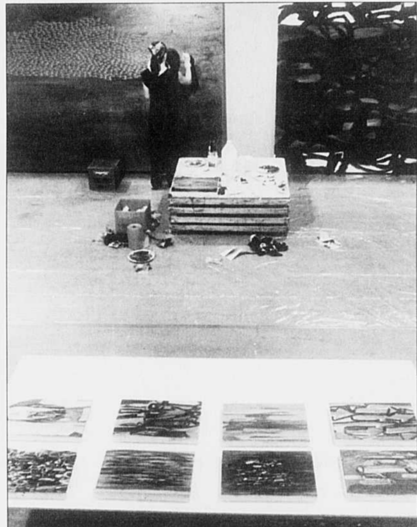
La création en direct, au Symposium de Baie-Saint-Paul.