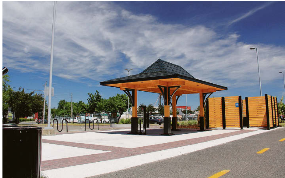
Vélogare à Acton Vale.

tion et de sa connectivité en tant que vaste réseau cyclable accessible, utile et sécuritaire, offrant diverses expériences à tous types d'utilisateurs.