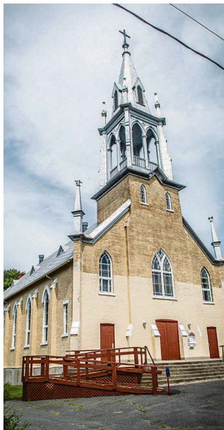
L'église de Sainte-Christine accueillera un frigo communautaire.